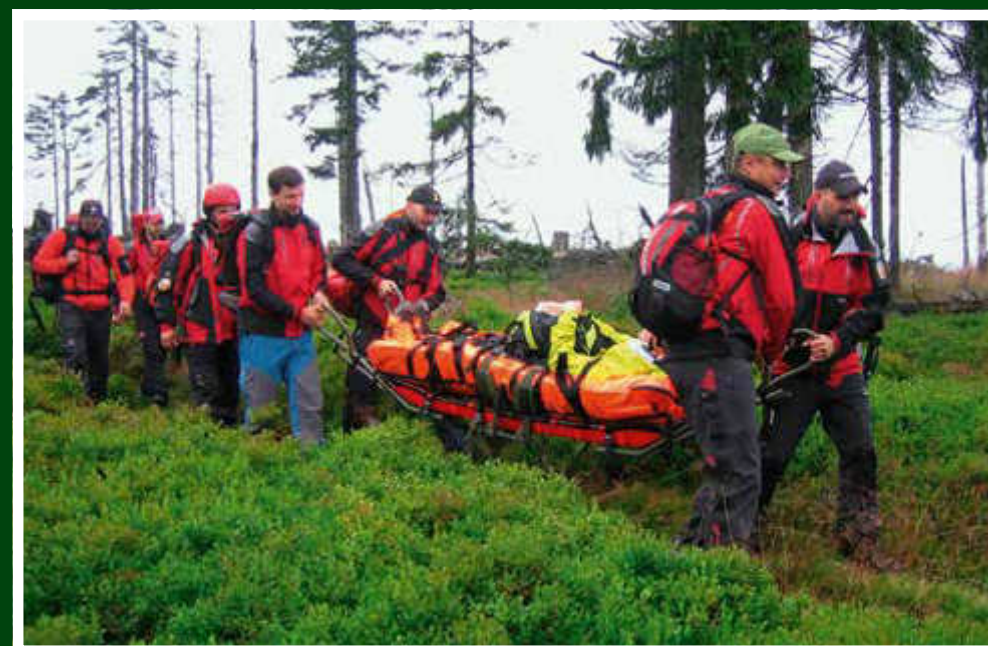
Transport zraněného z nepřístupného terénu – Svahov