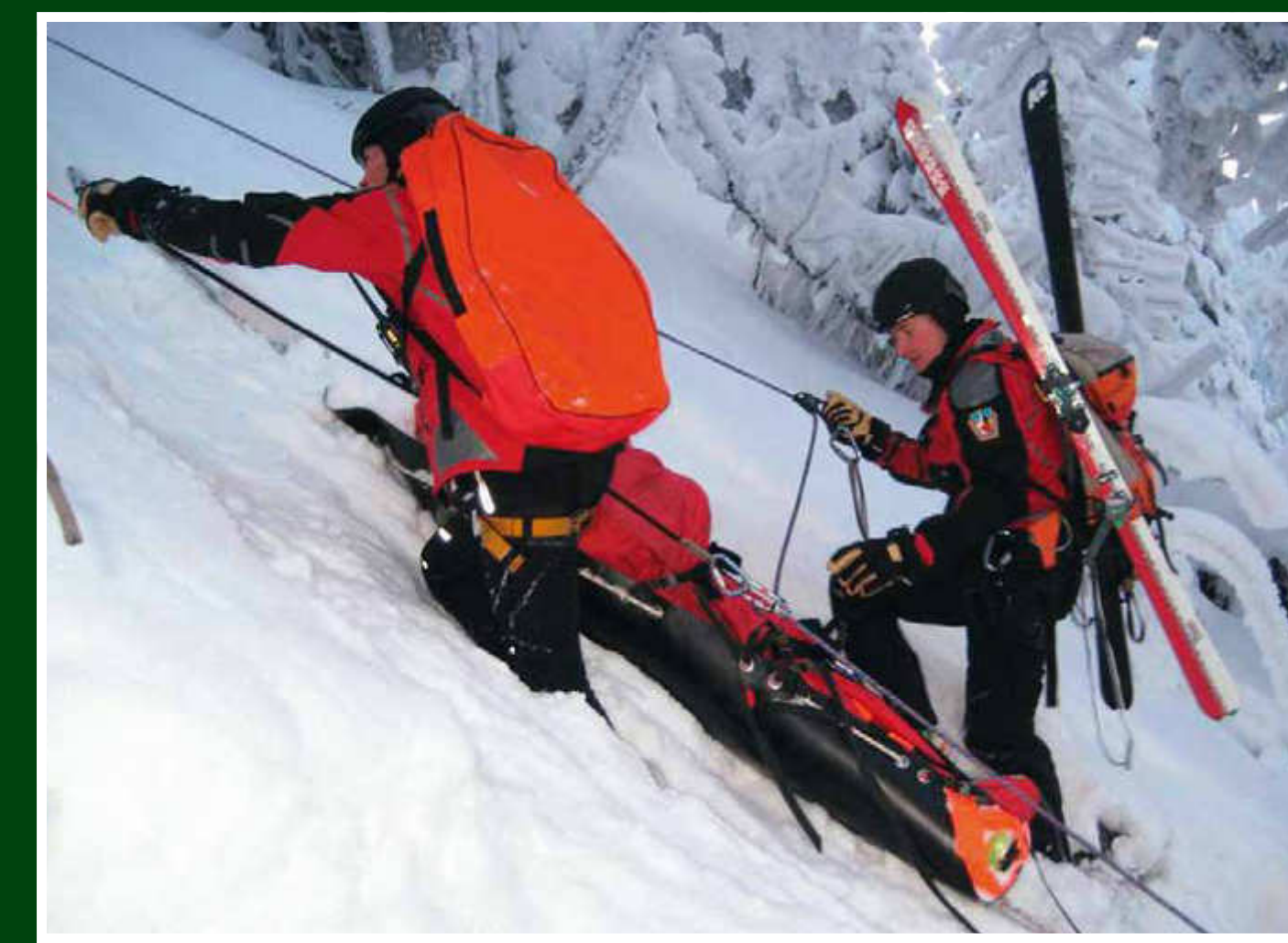
Nácvik transportu zraněného z nepřístupného terénu v zimních podmínkách