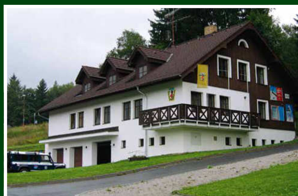
Ústředí HS Šumava na Špičáku