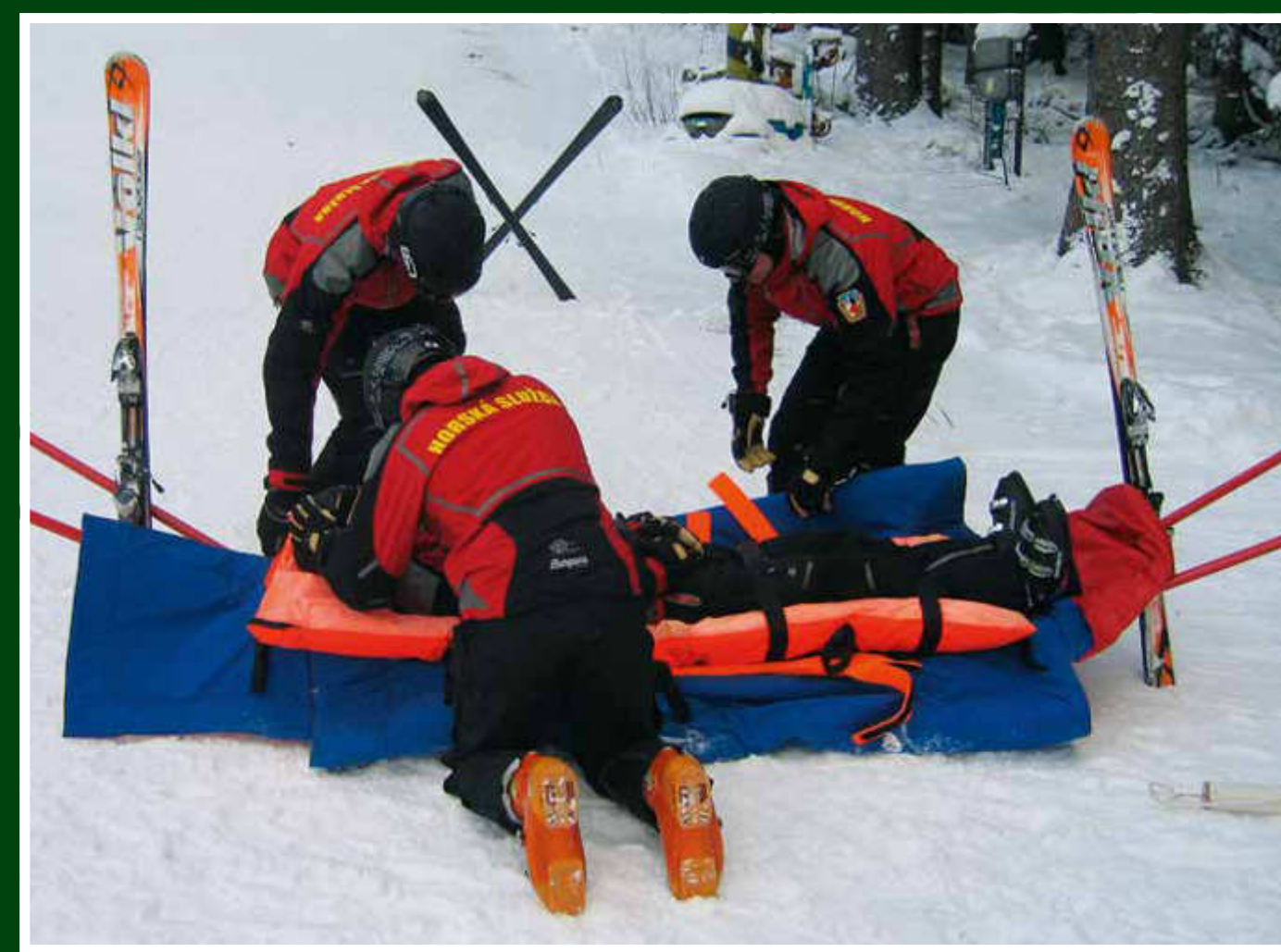
Ošetření zraněného na sjezdové trati