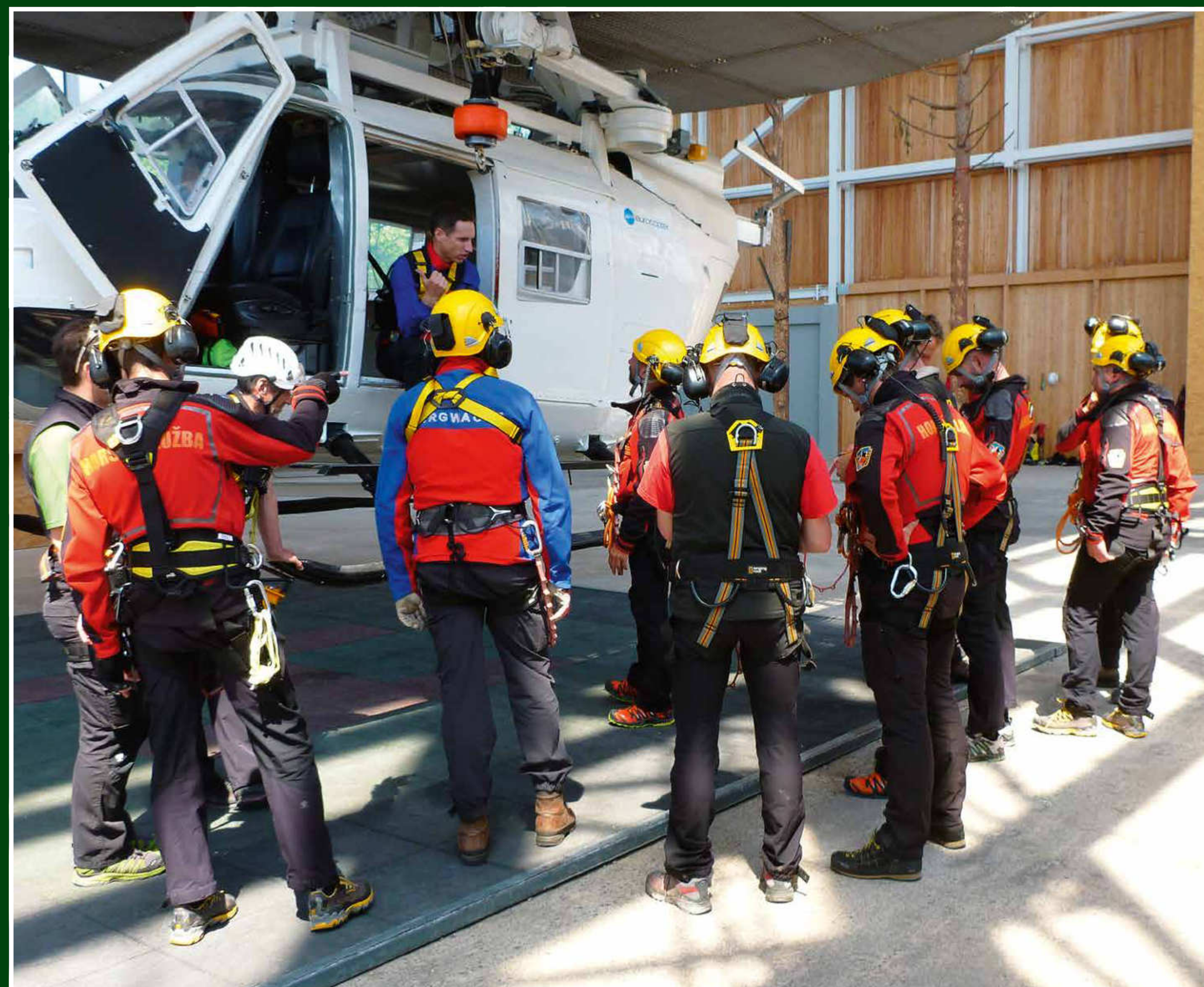
Společné cvičení HS Šumava a Bergwacht Bayern v Bad Tölz

Text: Jiří Bárta, Bc. Michal Jandura, DiS. Zpracování: Kolář & Kutálek grafické studio