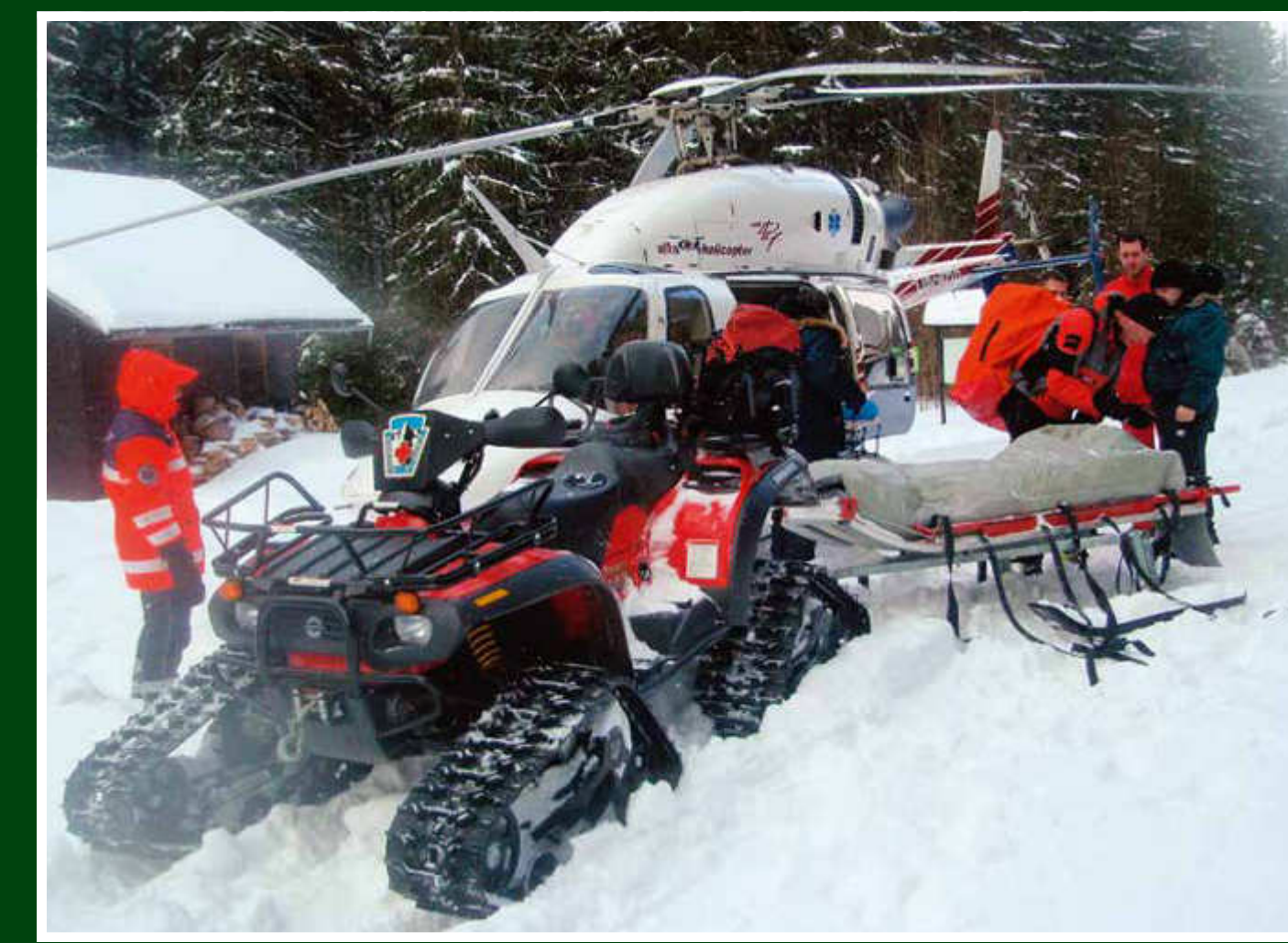
Součinnost HS Šumava a Letecké záchranné služby