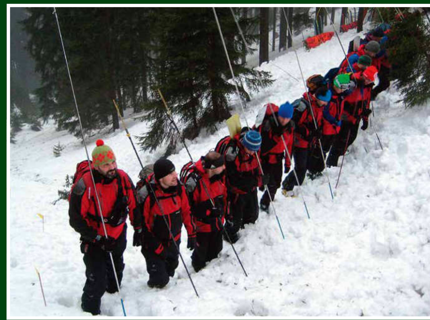
Lavinové cvičení HS Šumava a Bergwacht Lam a Zwiesel