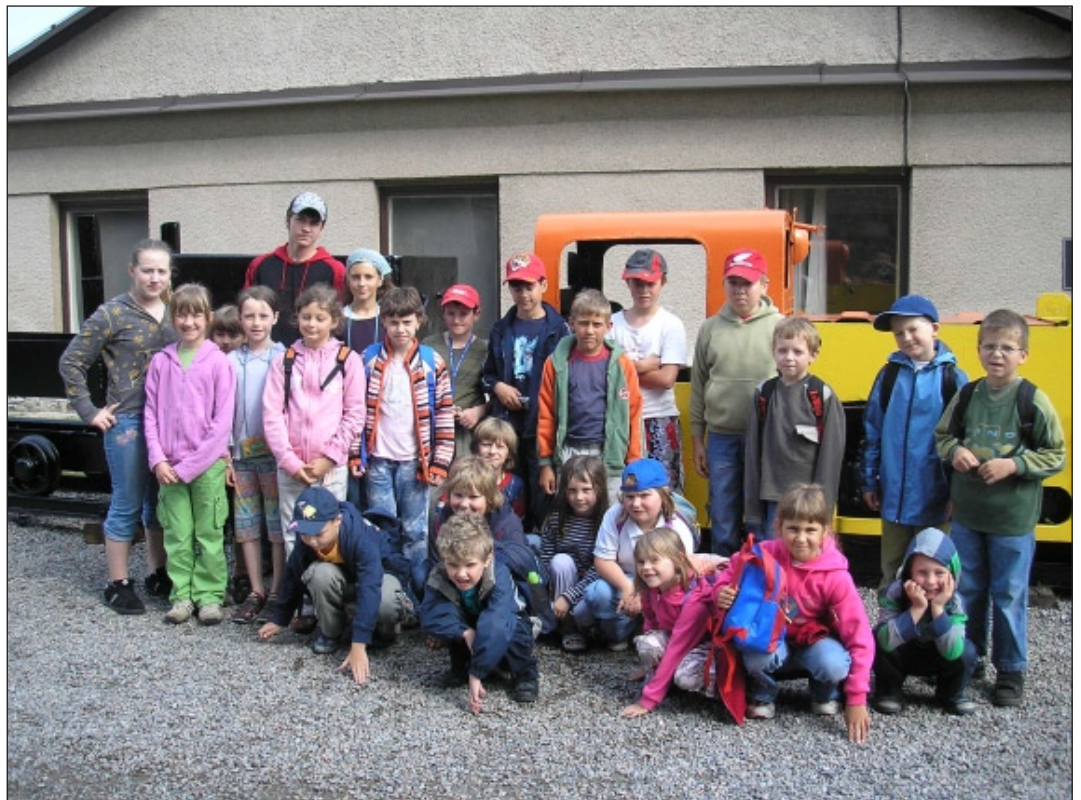
Děti ZŠ a MŠ navštívily také hornický skanzen Březové Hory. Zde se svezly hornickým vláčkem, podívaly se do Ševčinského dolu, navštívily podzemí dolu Drkolnov s vodním kolem a hornickou skluzavkou.

gramy, Lucie Ledvinová s 186 kilogramy a Jaromír Petřík s 179 kg. Za 1. místo v Plzeňském kraji jsme obdrželi 3 000 korun za jednotlivé svozy potom 6 848 korun. Zisk činil 9 848 korun. MŠ byl zakoupen DVD přehrávač, gymnastické a relaxační míče získala ZŠ. Dále byl zakoupen kožený fotbalový míč a dva míče na přehazovanou. Úložné sítě na míče byly také součástí nákupu.“