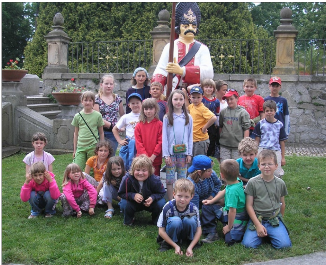
Každoročně jezdí děti ZŠ Dešenice na školní výlet. Tentokrát se byly podívat na zámku v Dobříši. Dodejme, že školní výlet byl hrazen ze sponzorského daru. Na výlet jsou každoročně zvány i děti z PŠ Bystřice.