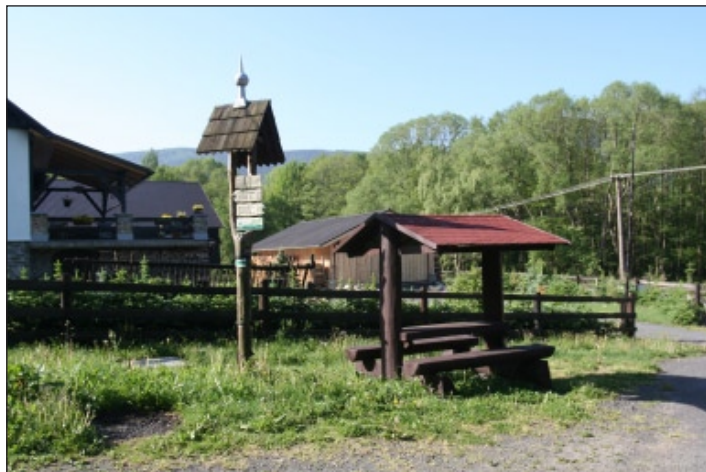
Ke stávajícím odpočívadlům pro cyklisty přibudou v dohledné době další a s nimi i nový informační systém.