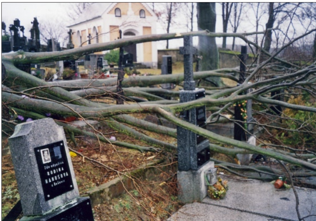
Takovýto pohled se naskytl občanům Dešenic na hřbitově po orkánu Kyrill. Bohužel dodnes se škody na hřbitově ještě řeší, neboť došlo k poškození tří hrobů. Liknavost úřadů, a také přehazování si problému jako horkého bramboru, je zatím výsledkem mnohých jednání, která uspokojení městyse ani občanům nepřinesla.

I když komunikace vždy vyčistili a překážky odstranili, ráno 19. ledna se asi nestačili divit. Jakoby zde vůbec nebyli. Vichr, který přišel i po půlnoci, pustošil krajinu dál. Nejvíce škod způsobil opět na výše zmínovaných komunikacích, ale také v samotných Dešenicích, kde se podepsal na větrolamu, který pokrýl nejen několik obydlí, ale strhl i dráty elektrického vedení. V tomto pří-