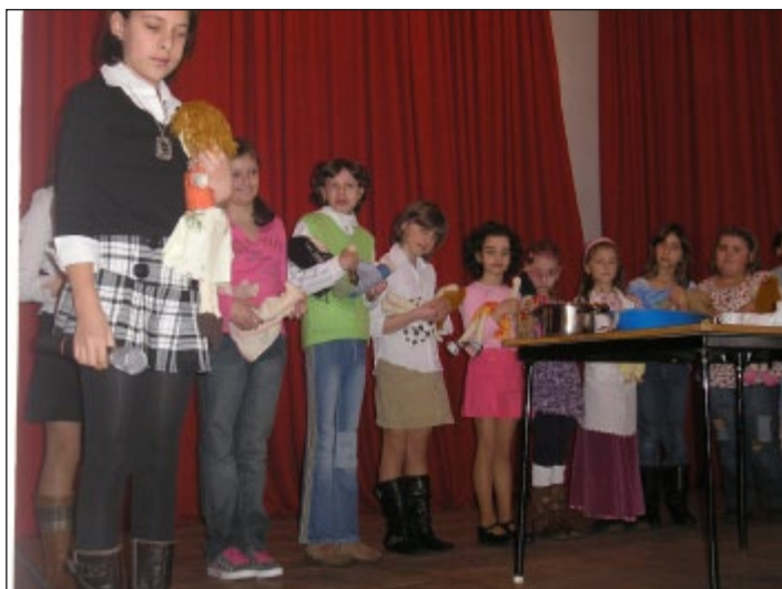
Vystoupení dětí na oslavách MDŽ.