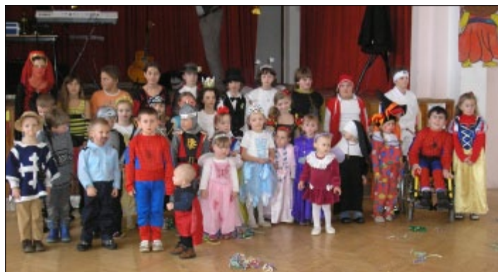
Hromadná fotografie masek před zahájením karnevalu.