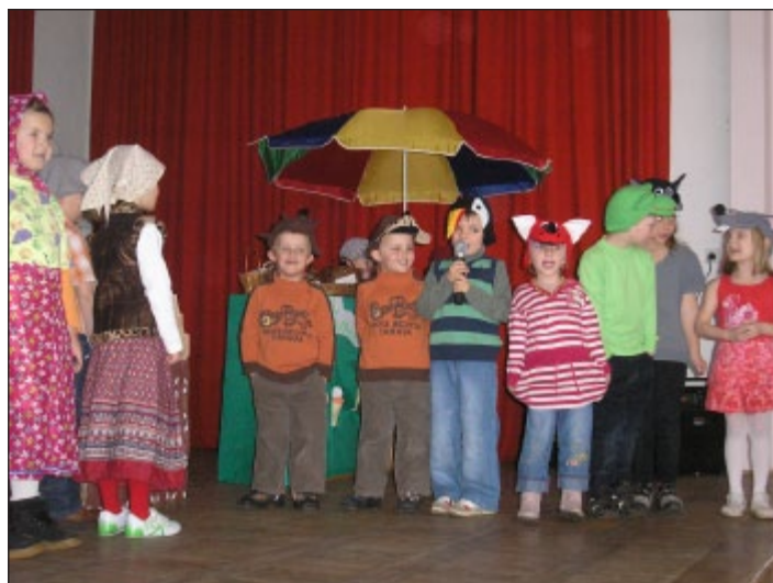
Další foto na www.zsamsdesenice.info ve složce nová fotogalerie.