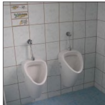
... a takhle vypadají po rekonstrukci.