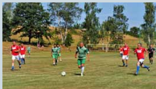
70. VÝROČÍ ZALOŽENÍ FOTBALOVÉHO KLUBU VE SVĚRADICÍCH