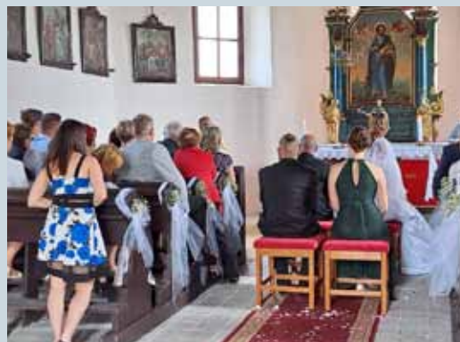
SVĚRADICKÝ KOSTELÍK KE SVATBÁM JAKO STVOŘENÝ str. 5