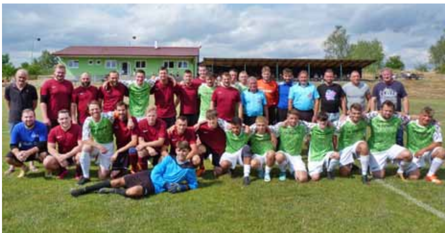
Společné foto "A" mužstev Svěradic a Chanovic

Od 16:00 hodin pak začal hlavní zápas sobotního odpoledne, a to duel „A“ týmů Svěradic a Chanovic. V obou