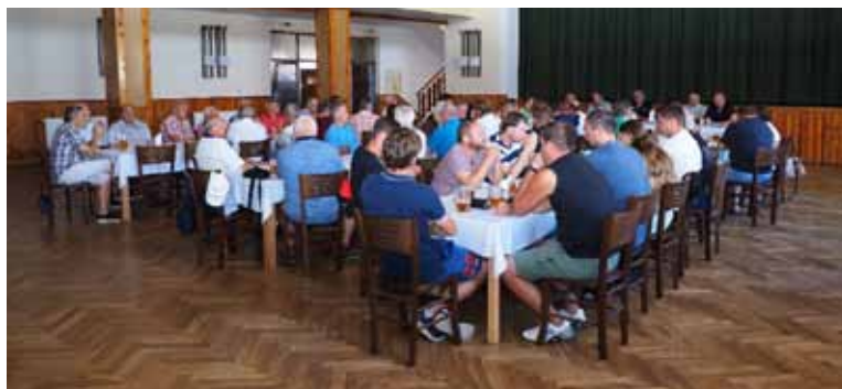
Pohled do zaplněného sálu KD