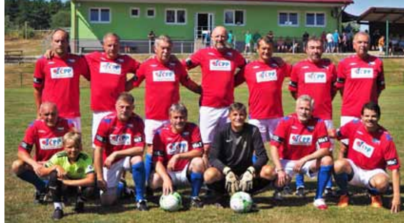
Mužstvo Klubu českých internacionálů