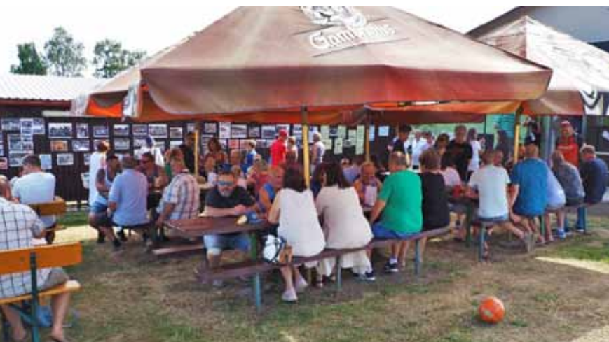
Zaplněné sezení pod slunečníky