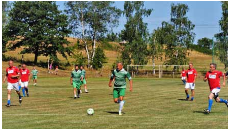
Momentka ze zápasu