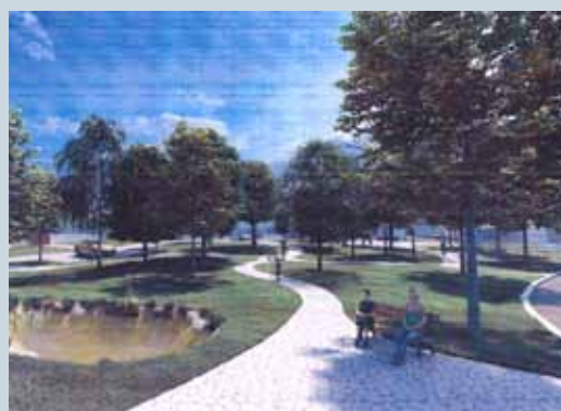
REVITALIZACE NÁVSI A VEŘEJNÉ PROJEDNÁNÍ NÁVRHU str. 4