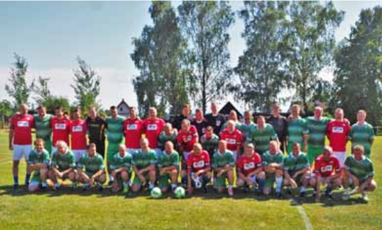
Společné foto obou mužstev

Na závěr lze konstatovat, že oslavy proběhly v důstojné atmosféře, a již teď se můžeme těšit na další kulatiny, to znamená osmdesáté. Takže v roce 2033 na shledanou. vd