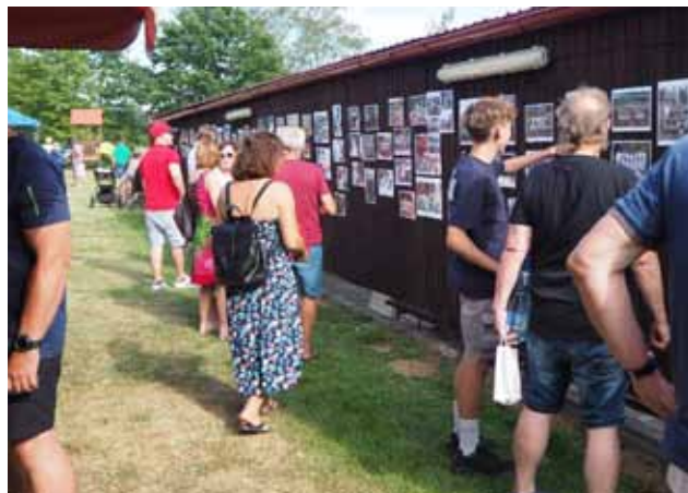
Lidé si prohlížíjí výstavu k 70. výročí