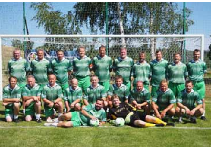
Mužstvo FK Svěradice (nad 40 let)