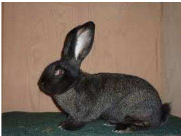
belgický obr černý

Jak již bylo v minulém příspěvku uvedeno, je to králík velmi, velmi velký. Hmotnost králíka je průměrně 7 - 10 kg. Tělo mohutné, dlouhé,