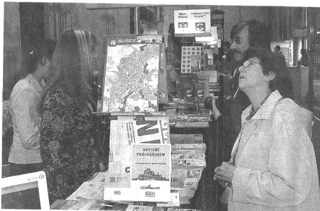
Stánek měst Klatovy, Sušice a Železná Ruda na veletrhu cestovního ruchu Regiontour 2007 v Brně

Na veletrhu známém pod názvem Regiontour každoročně představují své produkty cestovního ruchu podnikatelé, obce, regiony i kraje z celé České republiky.