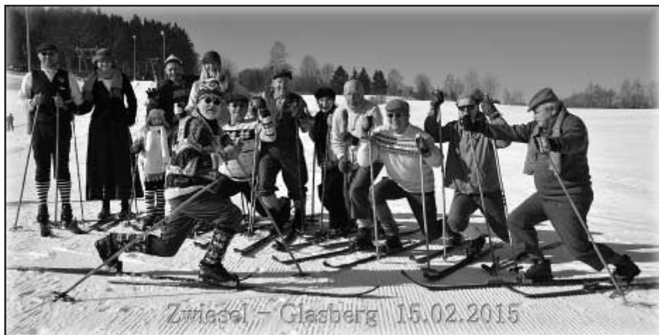
Skupina historických lyžařů z Klatov a Písku budila v Bavorsku zaslouženou pozornost