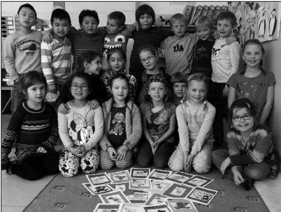
Valentýn v knihovně: Děti ze druhé třídy vyrobily krásné Valentýnky