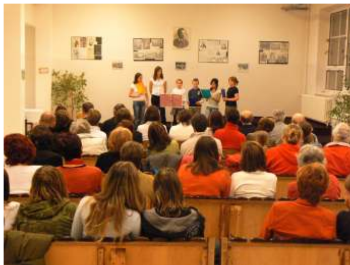
Horní snímek zachycuje atmosféru po adu. Dole vlevo: hudební doprovod Dole vpravo: zájem o výstavu knih K.K.

Komorní společenská akce započala kulturní seriál k roku Karla Klostermanna, která bude prolínat celý rok 2008.