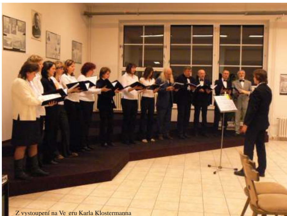
Z vystoupení na Večeru Karla Klostermanna

8. března uspořádali zahraniční členové ŽSS hudební večer ve Frauenau. Rádi jsme přijali jejich nabídku na vystoupení v rámci této akce. Náš tématický hodinový koncert se setkal se zájmem návštěvníků a byli jsme odměněni i upřímným potleskem. Přijemným zpestřením večera byla kapela místních hudebníků, která hrála a zpívala naše české lidovky. Spontánní společné zpívání našeho sboru a bývalých členů již zaniklého pěveckého spolku z Frauenau uzavřelo tuto neformální bavarsko-českou kulturní akci (L. Löffelmannová)