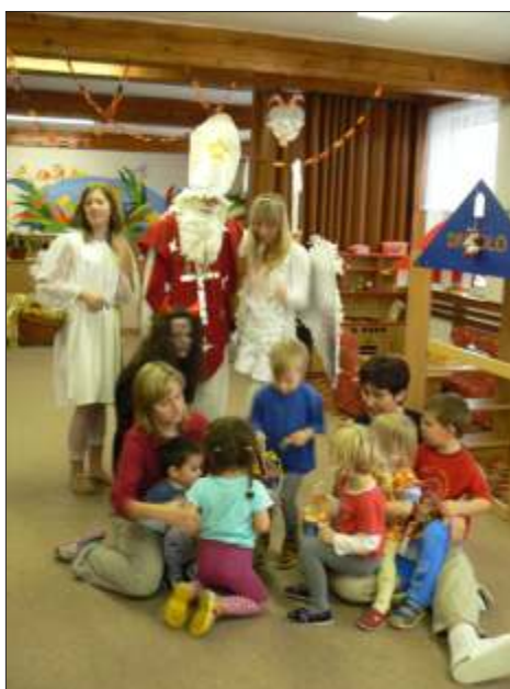
Mikulášská družina v MŠ

Jako již po mnoho let, i letos 5. prosince zavítal mezi školáky Mikuláš se svou and lskou a pekelnou suitou. And lé m li plné košíky dobrot pro hodné d ti a erti zase uhlí pro zlobivce a pytle na neposlušné žáky.