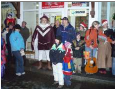
Ze zahájení zimní sezóny