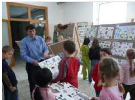
Pan editel pochválil d ti za práci