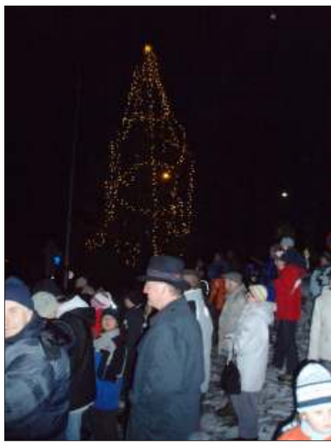
Rozsvícení vánočního stromu

Vážení spoluobčané, vážení návštěvníci Železnorudska, adventní čas je doba, kdy chystáme dárky svým blízkým a těšíme se na sváteční čas vánoční. Za několik dalších dní budeme oslavovat a vítat nový rok.