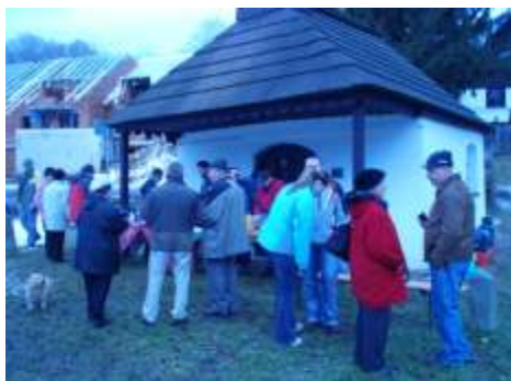
Ani po ínající stmívání nekon ilo setkání