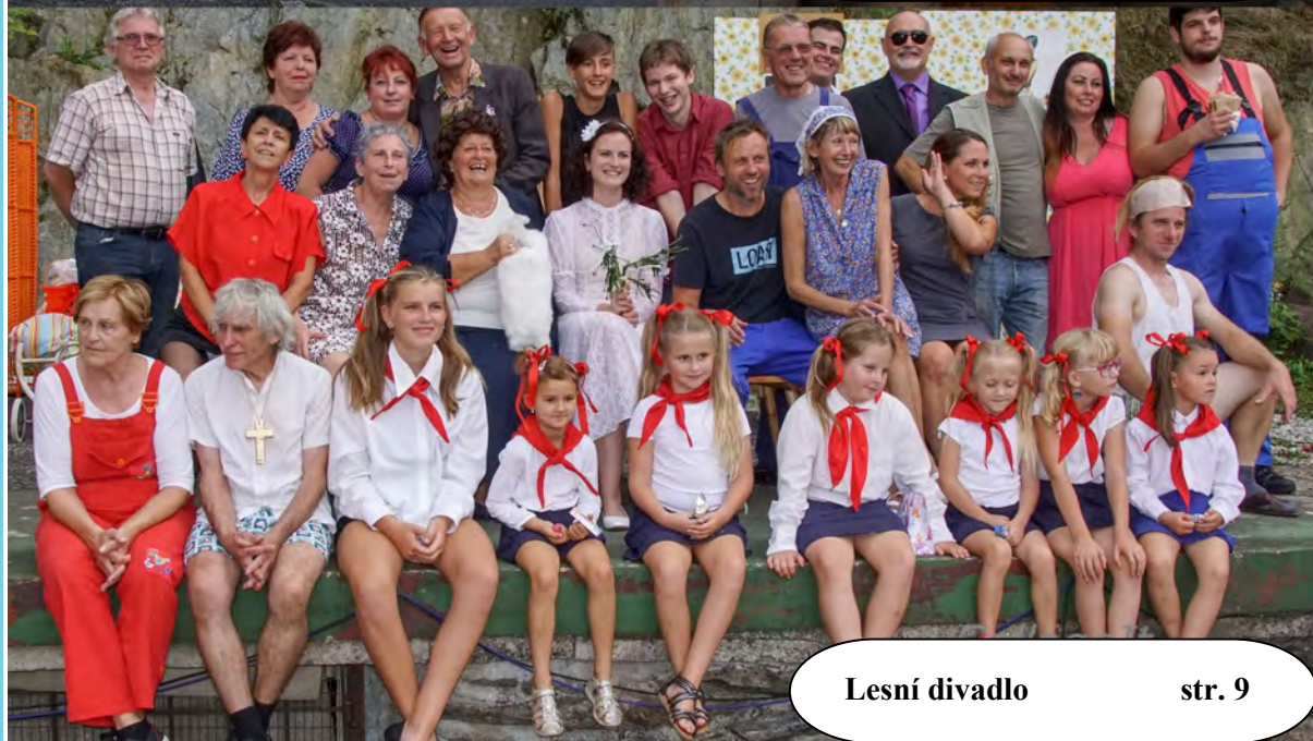
Lesní divadlo str. 9