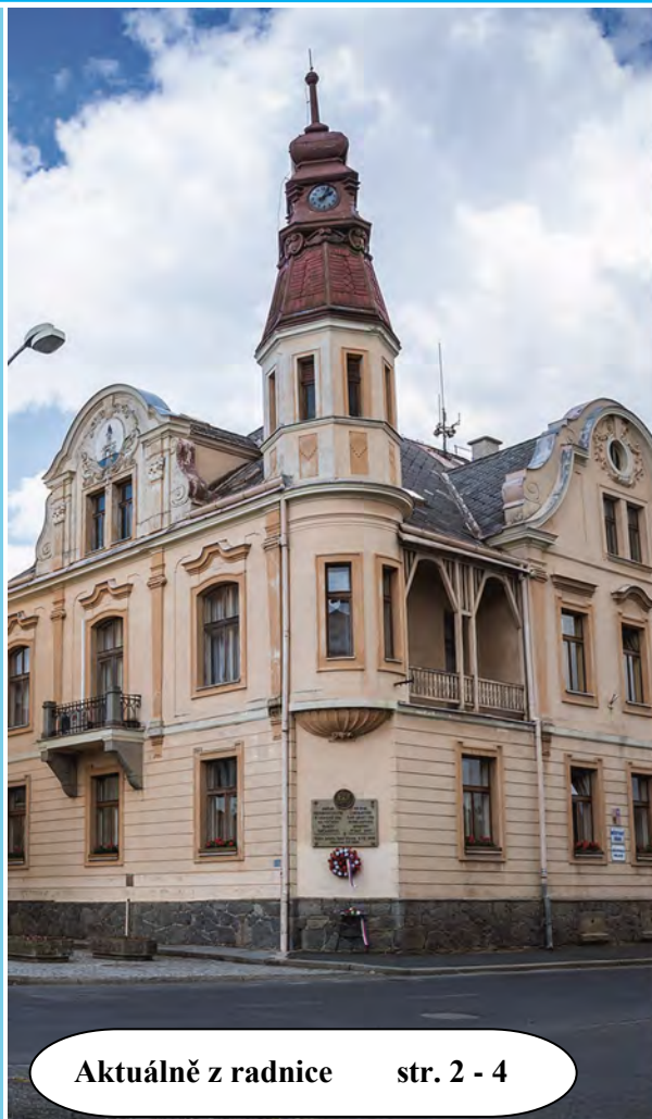
Aktuálně z radnice str. 2 - 4

Leden, ten je vlastně prima, i když je nám hrozná zima. Vrátime se zmrzlí domů, dáme čaj (a něco k tomu).