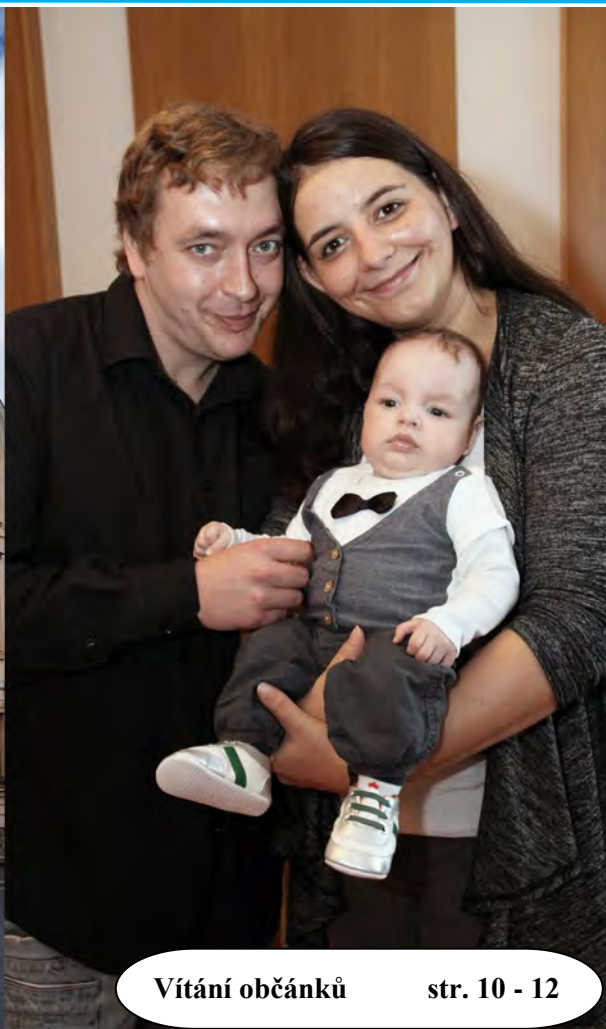
Vítání občánků str. 10 - 12