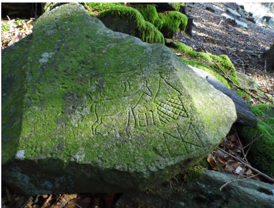
Koně - pošta

veliké množství a které jsou někdy i nevýrazně vytesané, ani není možné. Stává se, že si při každém prohlížení všimneme nějakého nového detailu. Nedávno jsem fotografie ukazoval paní Čermákové, protože se nemohla zúčastnit schůze, kde jsme si je prohlíželi. Přepínám z obrázku na obrázek a ona najednou povídá: „Počkejte, na minulém obrázku jsem zahlédla ciferník s rafičkami nastavenými na osm hodin a sedm minut. A tady na tom obrázku je vidět jiný ciferník a čas je tam stejný!“ Kroutili jsme nad tím společně hlavou. Později jsme našli mezi ostatními obrázky ještě další dva hodinové ciferníky, i když poměrně nezřetelně vytesané, a na nich je velmi pravděpodobně zachycen stejný čas. Proč je tam uveden stejný čas v roce 1887 i v roce 1881? Musel to být velice důležitý údaj, když si někdo dal tu práci vytesat tuto informaci do kamene. Do velmi tvrdého kamene! Když už jsme u té obtížné práce, navštívili jsme pana Václava Fialu, známého klatovského sochaře, s jediným kamenem, který jsme z lesa odnesli, aby jej