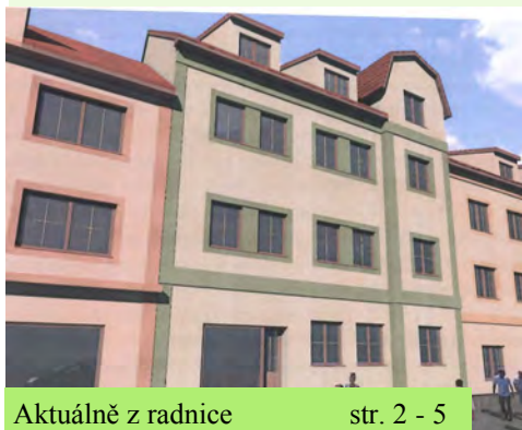
Aktuálně z radnice