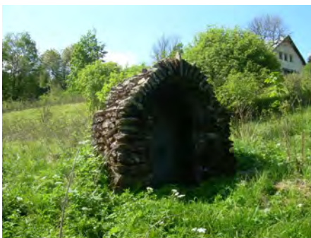
studánka pod kaplí na Prenetu

chodním svahu mezi Prenetem a Můstkem. Svah je v těchto místech vlastně amfiteátrově modelovanou kotlinou připomínající svým tvarem velký ledovcový kar. Údolí Jelenky je velice úzce zahloubené v rokli ve tvaru písmene V s velmi strmými svahy, které porůstá místy pralesovitý porost, tzv. hercynské směsi (smrk, jedle, buk). Nenechme se však mýlit vzhledem. To, co dnes vypadá jako prales, bylo koncem 18. století, kdy je podle Místopisného slovníku Šumavy datován vznik Suchých Studánek, odlesněnou