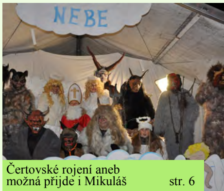
Čertovské rojení aneb možná přijde i Mikuláš