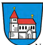
Neukirchen b. Hl. Blut