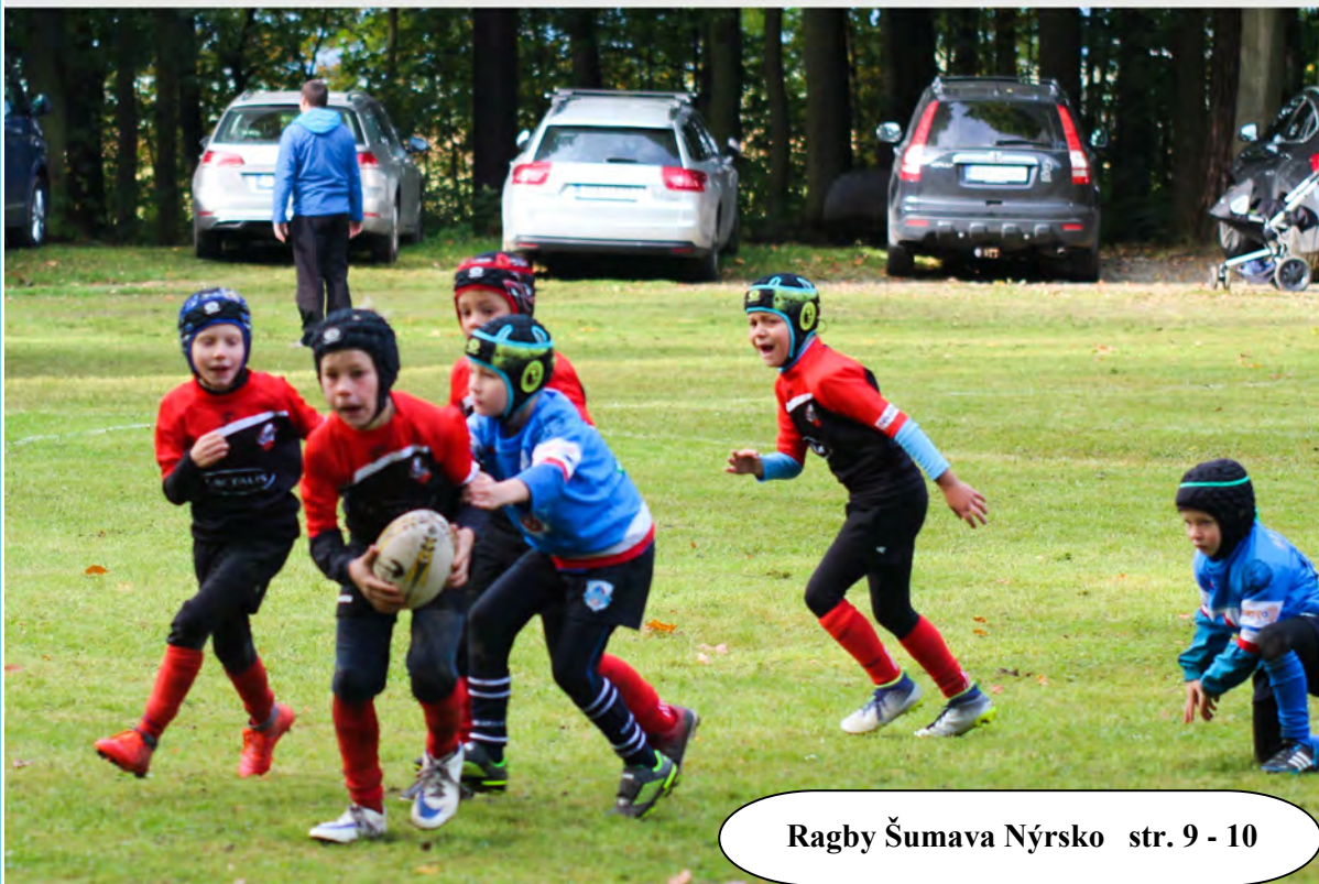
Ragby Šumava Nýrsko str. 9 - 10