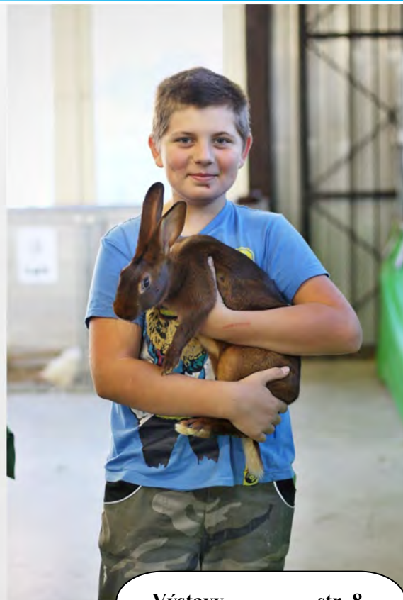
Výstavy str. 8