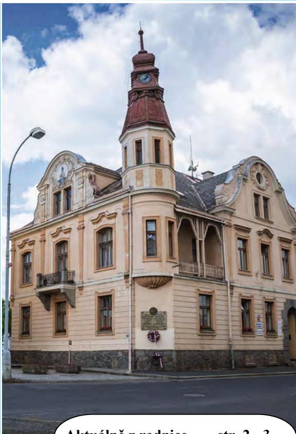
Aktuálně z radnice str. 2 - 3

„Když na svatého Ondřeje sněží, sníh dlouho poleží.“