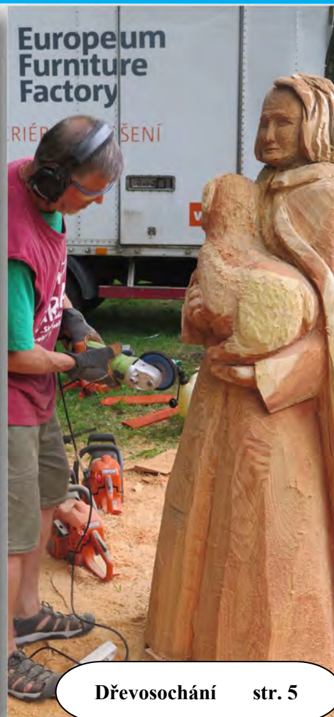
Dřevosochání str. 5