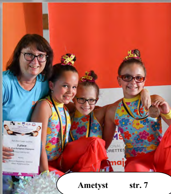
Ametyst str. 7