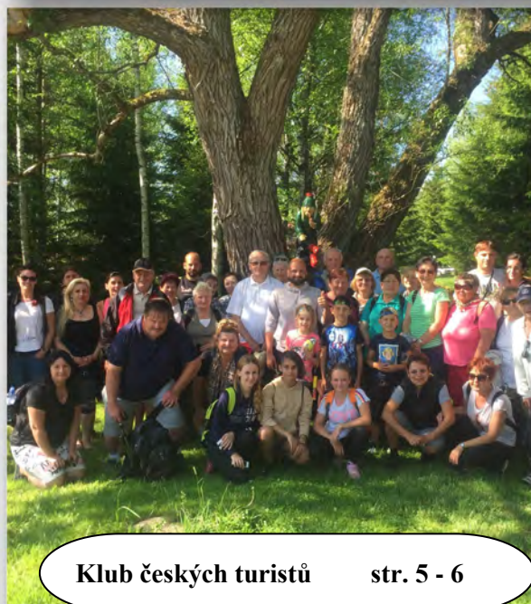
Klub českých turistů str. 5 - 6