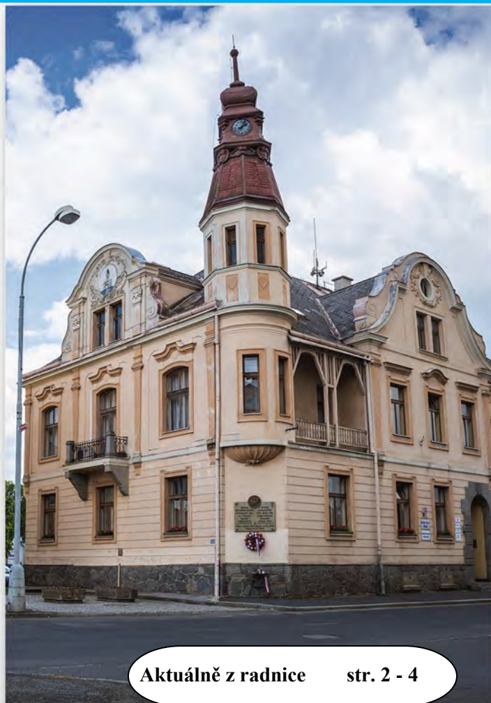
Aktuálně z radnice str. 2 - 4

„Svatý Jakub dá vá kukuřici klasy, svatá Anna vlasy.“