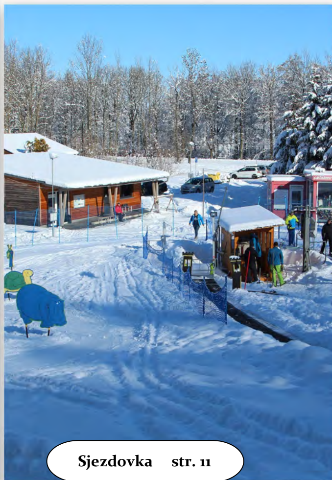
Sjezdovka str. 11