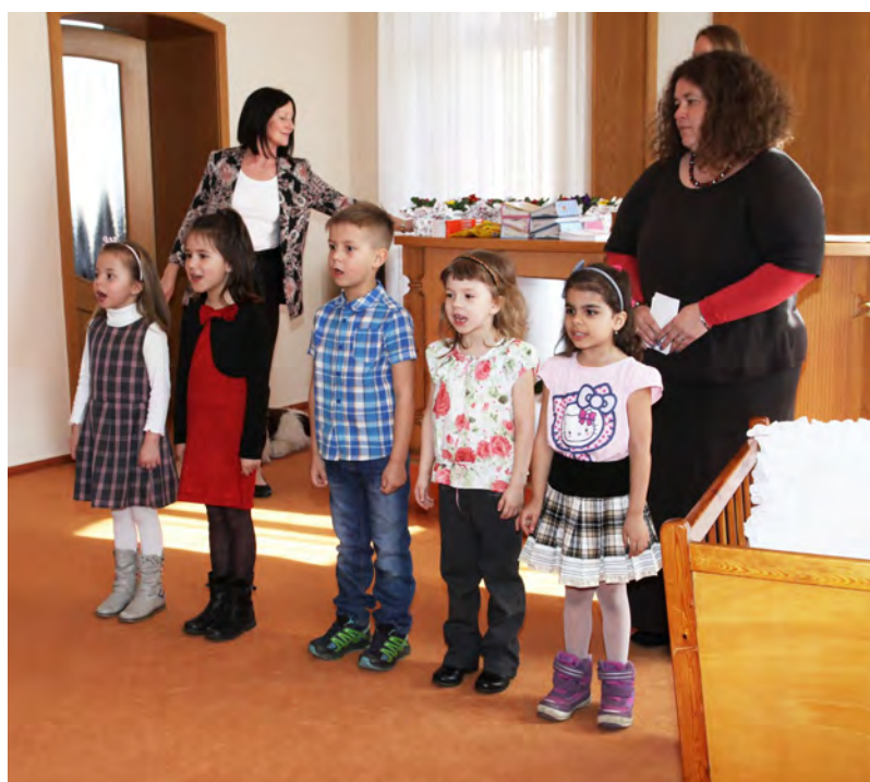
Děti z Duhové školky