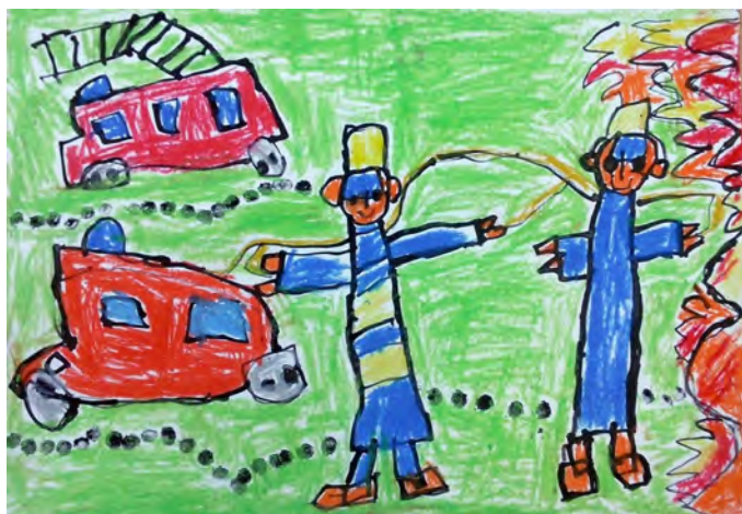
Honzík T., 5 let

Příroda kolem nás se teprve probouzí, ale děti z Duhové školky nezahálely ani během zimy. Kromě běžných denních aktivit malovaly obrázky do několika výtvarných soutěží. Pro Český zahrádkářský svaz na téma „Moje oblíbená rostlina“, pro Sdružení hasičů Čech, Moravy a Slezska na námět „Požární ochrana očima