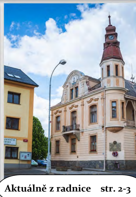
Aktuálně z radnice str. 2-3