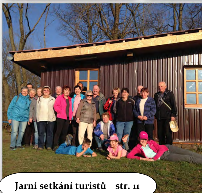
Jarní setkání turistů str. 11