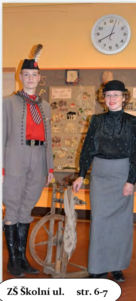
ZŠ Školní ul. str. 6-7