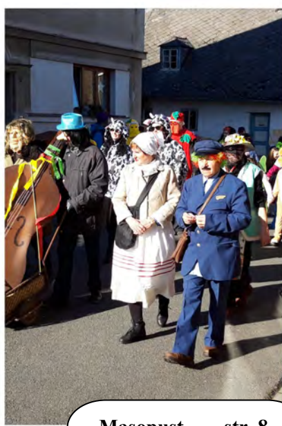
Masopust str. 8