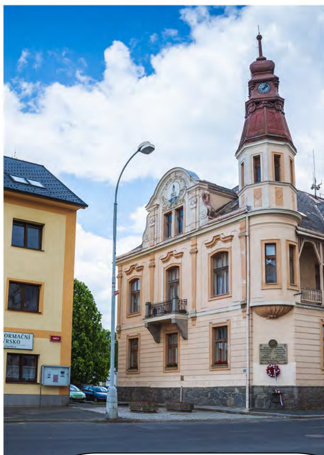
Aktuálně z radnice

„V březnu vítr, v dubnu déšť - pak jistě úrodný rok jest.“