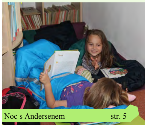
Noc s Andersenem