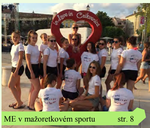
ME v mažoretkovém sportu