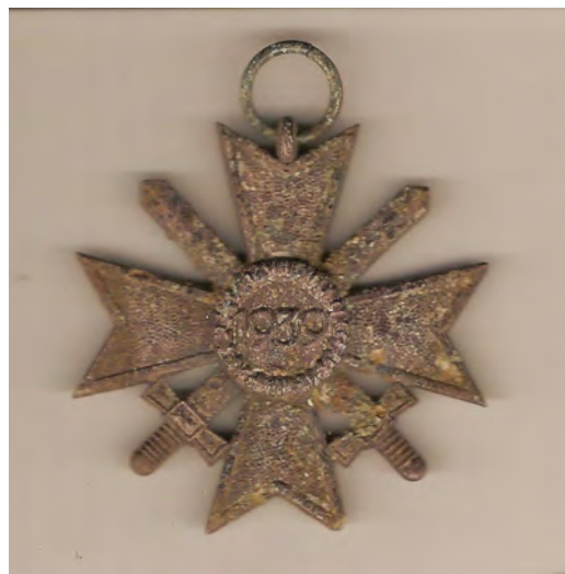
Text + foto: Karel Velkoborský, MKH

Potěšilo nás také, že nám vedení města přidělilo dotaci na naši práci. Je trochu nižší, než jsme žádali, ale nějak to zvládneme. Je pravda, že do lesa už asi jezdit nebudeme. Snad se to podaří jinak. V každém případě jsme za dotaci vděční, protože nám pomáhá realizovat plány, o kterých si myslíme, že přinášejí městu prospěch. Na peníze bývá delší fronta než na práci.