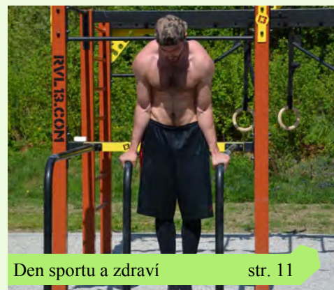
Den sportu a zdraví