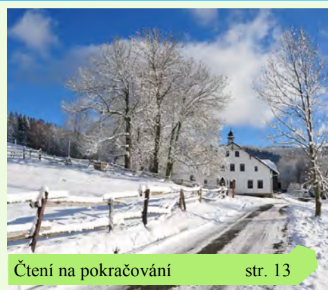
Čtení na pokračování