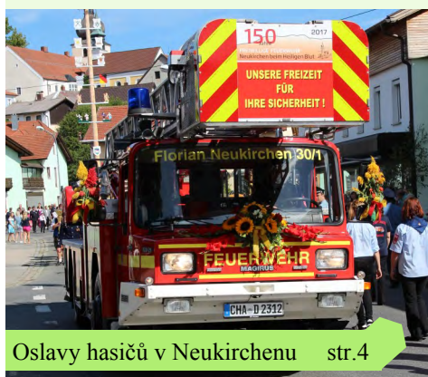
Oslavy hasičů v Neukirchenu str. 4