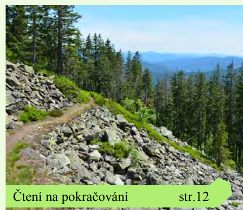
Čtení na pokračování str. 12