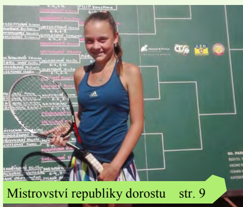
Mistrovství republiky dorostu str. 9