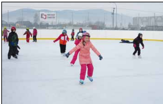
O bruslení na kluzišti je zájem.

Jen pro připomenutí uvádím, že od poloviny letošního roku bude zřízena městem nová příspěvková organizace, která bude mít na starosti správu vybraných sportovišť města včetně jejich využití. S koncepcí jsem seznámil dnes již bývalý výbor SKP Okuly Nýrsko, který neměl zásadní připomínky k navrženému postupu.