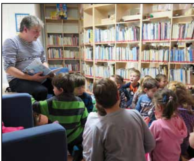
Společná čtení a další aktivity pro děti.

Do knihovny se přihlásilo celkem 473 čtenářů (z toho 116 do 15 let), kteří si vypůjčili 22 950 knihovnických dokumentů. Veřejný internet využilo 678 návštěvníků a webové stránky navštívilo 5 114 uživatelů. Uspořádali jsme 180 vzdělávacích akcí (knihovnické lekce pro školy, kurzy malování pro děti a dospělé, kurzy power jógy, Virtuální univerzita třetího věku, turistické výlety, soutěže, tvořivé dílny atd.) s návštěvností 2 352 účastníků a 67 kulturních akcí (divadelní představení, přednášky, besedy, koncerty, výstavy, společná čtení pro děti, zájezdy, zábavné pořady...), které navštívilo 6 085 diváků. Výdaje na tyto akce dosáhly částky 309 119 Kč a jsou pokryty z rozpočtu města Nýrsko. Příjmy činí 223 140 Kč.