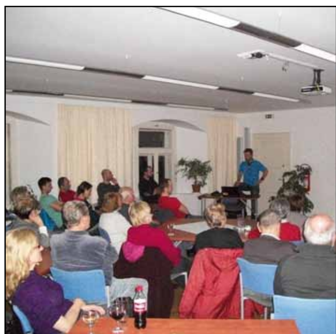
Z přednášek v knihovně.