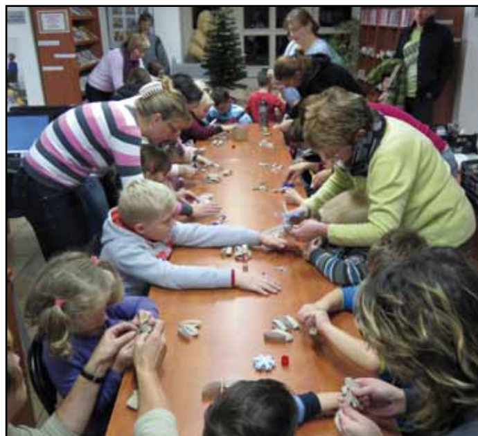
Tvoření je v knihovně už tradicí.

V roce 2015 vzrostl knihovní fond o 426 nových knih v hodnotě 65 000 Kč. Nízký počet přírůstků byl způsoben přechodem na nová katalogizační pravidla a nový knihovní systém Tritius. Odebírali jsme 38 titulů periodik. V letošním roce si nově můžete přečíst časopis v retro stylu Darina, plný lidových tradic, mouder a zvyků. Přeneše na vás kouzlo starých časů a navede vás do doby našich předků. Něco pěkného na sebe si ušijete podle časopisu Burda. Zajímavosti z přírody vám přináší časopis Šumava. Pohádky, ilustrace, úkoly a tvoření najdou děti v Dráčku a pro mládež jsou nově připraveny Monster High a Top dívka.