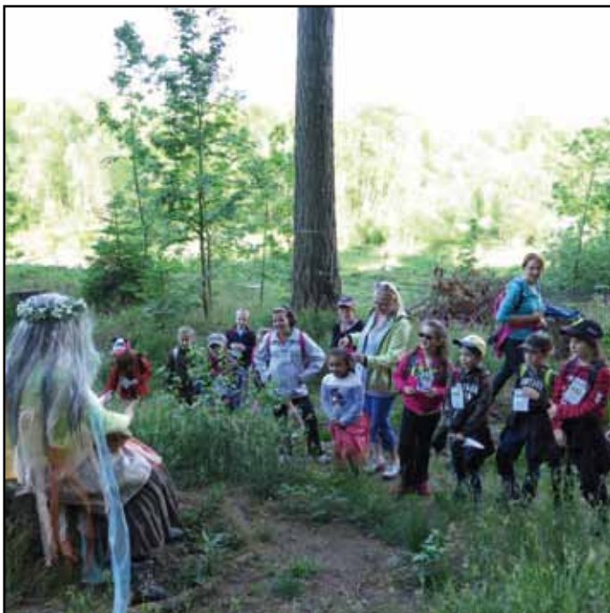
Noc s Andersenem v lese pod Pajrekem.