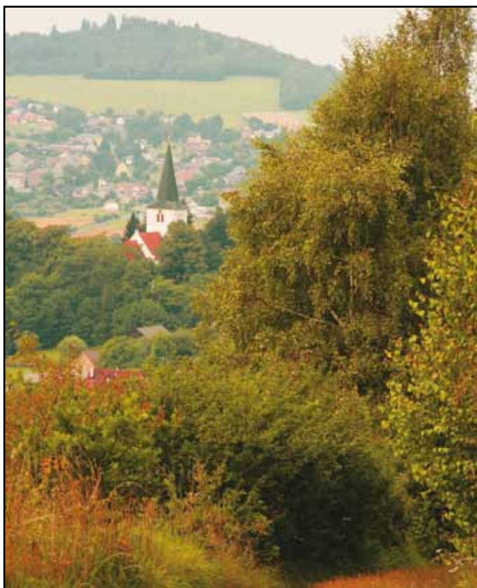
Loučim s kostelem Narození Panny Marie.

Dějiny zdejší židovské náboženské obce připomíná starý hřbitov, sloužící pěti židovským obcím – Dlažov, Kdyně, Koloveč, Loučim a Všeruby – založený těsně po roce 1841. V obci najdeme i další památky a zajímavosti – barokní budovu fary z druhé poloviny 18. století, státem chráněné lípy se sochou sv. Jana Nepomuckého, pomník mistra Jana Husa či starou roubenou chalupu čp. 3. -mk-