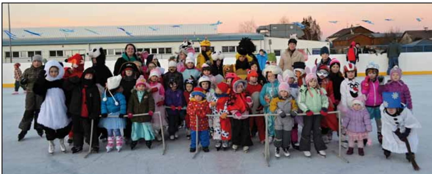
Děti si řádění v maskách na kluzišti náležitě užily.

Povím vám, pořádat karneval na otevřeném kluzišti je pořádný adrenalin. Počasí si s námi hrálo jako kočka s myší. Dva dny poprchávalo a kluziště připomínalo spíše malý bazének s vodou. Rozhodnutí jsme nakonec nechali na ráno. Vypadalo to slibně, mokrý flíček v brankovišti jsme velkoryse ohodnotili jako malou hrozbu, se kterou si poradíme. Ovšem slunce se přes poledne vyhouplo vysoko a hrálo jako na jaře. Ve dvě hodiny odpoledne jsme už zase měli třetínový bazén a nádherné počasí. Kolem kluziště jsme chodili jako mlsní kocouři a kluci od ledu rozhodli: „To půjde, slunce se přehoupne a v půl páté už bude zima.“ A oni měli pravdu.