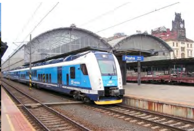
Elektrická jednotka InterPanter (ŠKODA 10Ev) Českých drah v Praze

Vrátíme-li se závěrem zpět k „naší“ trati, tak oslavy 140. výročí jsou předběžně plánovány na sobotu 17. září 2016, týden před Národním dnem železnice, který se letos odehraje v Chebu. Součástí oslav by měly být jízdy parních vlaků; podrobný program však bude zveřejněn až později. Navazující traťový úsek z Nýrska do PPS v Alžbětíně potom oslaví 140. výročí uvedení do provozu dne 20. října 2017. Přejme si, aby celá trať dokázala ve své zmodernizované podobě uspokojivě plnit přepravní potřeby cestujících i v budoucnosti.