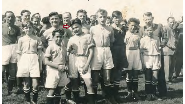
1. máj 1950 A mužstvo a žáci oddílu