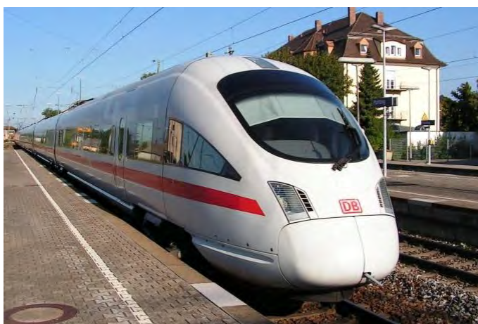
Elektrická jednotka ICE-T Německých drah v Plattlingu