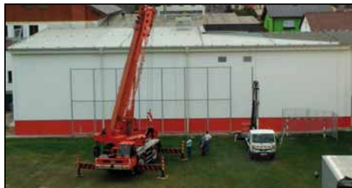
Výměna zábran za brankami na školním hřišti.

Do konce kalendářního roku nás čeká realizace projektu z EU zaměřeného na jazykovou vybavenost dětí. V rámci tohoto projektu vyjede v říjnu přibližně 15 dětí 1. stupně na zahraniční jazykový pobyt do Anglie. A nebudou se vzdělávat jenom děti, ale také učitelé, kteří již v září absolvovali čtrnáctidenní studijní pobyt