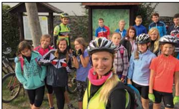
Účastníci zářijového cyklo-kurzu.

► Radost nám udělali hned v prvních dnech naši prvňáčkové, protože se dobře aklimatizovali, velmi se snaží a mají radost z pokroků a úspěchů, kterých každý den dosahují. Do všech aktivit se zapojují již jako opravdoví školáci a paní učitelka má radost, že se do školy těší. 1. září je ve škole symbolicky přivítali devátáci, kteří se s nimi v duchu tradice naší školy potkají v průběhu školního roku ještě při vánočním „stužkování“ a při „posledním zvonění“ v červnu, kdy na oplátku prvňáčkové devátáky ze školy vyprovodí.