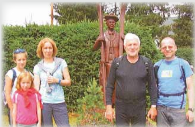
S Pepou na Kvildě.

Druhý výlet se obešel již bez problémů. Z Roviny nedaleko Hartmanic jsme přes Pustinu úspěšně doputovali do Rejštejna, který byl v minulosti sídlem významných českých sklářů. Po cestě jsme se kochali nádhernými výhledy.