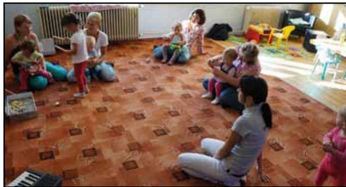
Aktivita v kroužku „Hudebníček“, který je určen pro menší děti.

Klubík založily 3 maminky na mateřské dovolené, které tam kroužky dětem nabízejí každodenně. Navštívit tak se svými ratolestmi můžete hudební kroužky, taneční, pohybová cvičení nebo třeba výtvarnou výchovu. Nechybí ani jednou týdně setkání maminek s dětmi. Děti se mohou vyřadit v herně a maminky u šálku kávy nebo čaje proberou vše důležité.