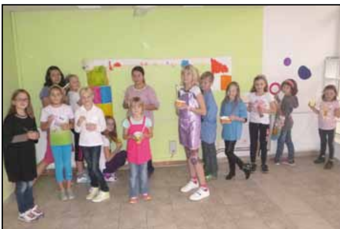
O práci s hlínou je zájem.