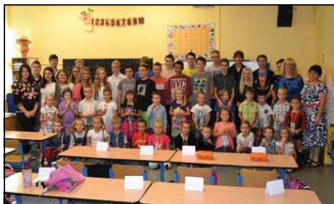
Prvnáčky přišli přivítat 1. září žáci deváté třídy.

► Nový školní rok jsme zahájili i výraznou změnou „image“ interiéru hlavní budovy naší školy. Chceme žákům i návštěvníkům školy ukázat, že i pěkné a moderní prostředí může mít vliv na formování osobnosti člověka. Pokračujeme v barevných proměnách školy a možná „trošinku“ nerealisticky očekáváme, že od září 2015 budou žáci chodit do naší školy ještě raději.