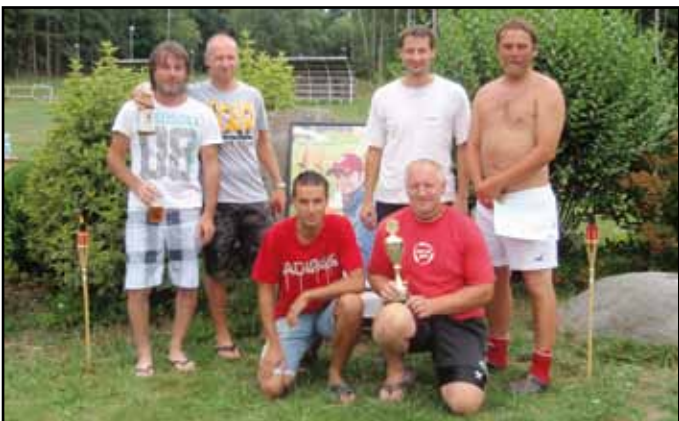
Druhé místo patřilo „Hokejkám“.