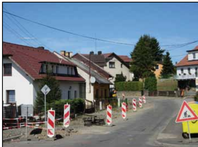
Na konci října bude Klatovská ulice kompletně zrekonstruována.

nost a správnost předložených dokumentů, fyzická kontrola se zaměřila na shodu stavu deklarovaného v žádosti o dotaci se stavem skutečným. Kontrolou nebyly zjištěny žádné nedostatky, došlo pouze k přesunu některých výdajů z uznatelných mezi výdaje neuznatelné. Na základě závěrů kontroly byla přiznána a na účet města zaslána dotace ve výši 5 mil. 842 tis. Kč. Celá akce byla realizována za 7 mil. 633 tis. Kč (uznatelné i neuznatelné náklady). Díky přiznané dotaci v uvedené výši došlo k významnému snížení dluhového zatížení města. (MěÚ)