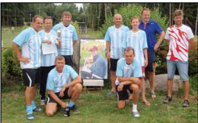
V boji o třetí místo porazili hráči „Staré Gardy“ tým „Tady a ted“ 2:0.