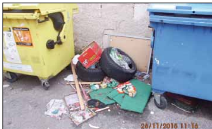
Nepořádek u kontejnerů není dobrou vizitkou.