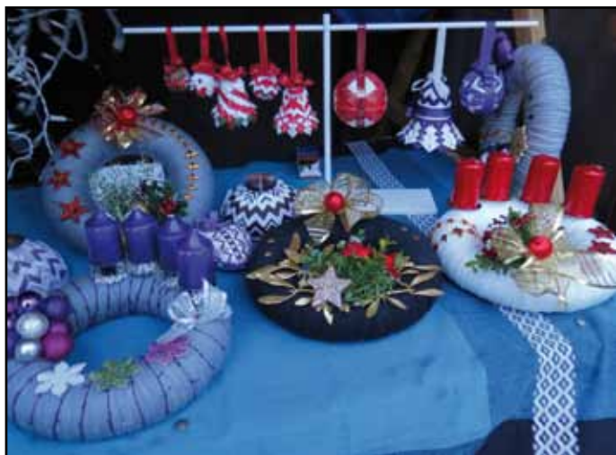
Ve stáncích bylo možné zakoupit i adventní věnce.