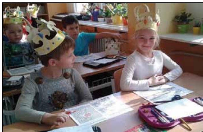
Žáci prvního stupně s korunou císaře a českého krále Karla IV.

Žáci 1. – 5. ročníku naplňovali cíle tohoto dne s mottem: „Karel IV. - římský císař a český král; my chceme vědět, co národu dal.“ Jejich den s Karlem IV. byl nejen plný zajímavých informací a dalších prací s nimi, ale také tvůrčích činností (máme krásné repliky korunovačních klenotů a Karlova mostu), převleků do historických kostýmů, ukázek z filmu Noc na Karlštejně a z DVD Dějiny udatného českého národa.