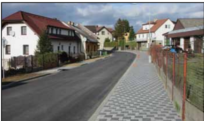
Klatovská ulice po dokončené rekonstrukci.