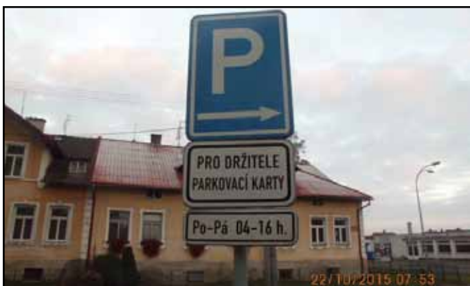
Označení parkování pro držitele parkovacích karet.

Na základě opakujících se stížností se strážníci zaměřili na parkování vozidel na parkovišti u školy u křižovatky ulic Komenského a Havlíčkova. Toto parkoviště je nařízením obce č.1/2007 o stání silničních motorových vozidel ve vymezených oblastech na území města Nýrska, mimo několika míst, vyhrazeno v době od 04:00 do 16:00 hodin pouze pro držitele parkovacích karet. Městská policie bude tolerovat pouze krátké stání vozidel rodičů přivázejících děti do školy ráno před osmou hodinou.