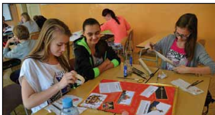
Aktivita v rámci projektu.

notili projektový den jako vydařený, protože se blíže seznámili se zajímavou historickou osobností a uvědomili si, že Karel IV. byl nejen velký politik, ale i velmi vzdělaný člověk s kulturním rozhledem a nadčasovým smýšlením, který by mohl být pro mnohé vzorem.