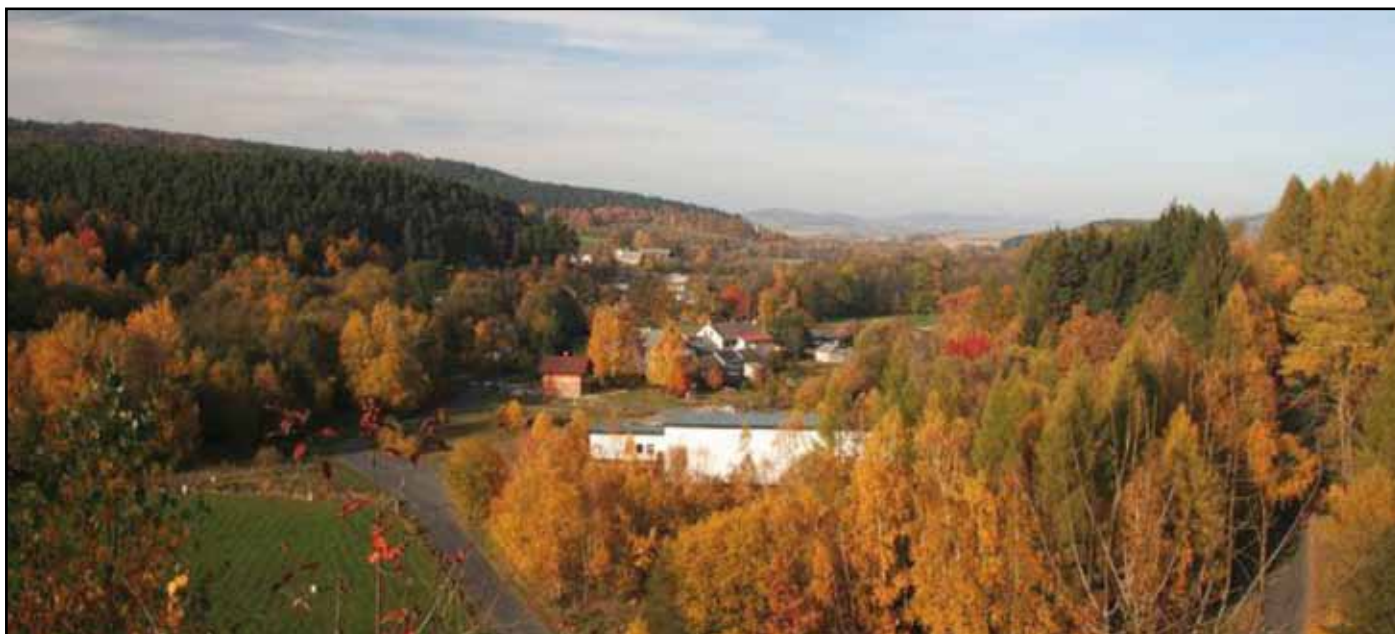
Úpravna vody v Milencích.

V tomto inkriminovaném období byla ze strany provozovatele vyvinuta maximální snaha na udržení kvality vyráběné a předávané vody a udržení všech zařízení v činnosti a to jak v průběhu dne, tak i v noci. Surová i vyrobená voda byla podrobována mnoha mimořádným odběrům nad rámec předepsaných počtů, několikrát bylo provedeno mimořádné vyčištění filtrů, byla nakoupena a osazena technologie na čerpání a dávkování flokulantu na likvidaci mikroorganismů, bylo prováděno nepřetržité sledování technologického procesu výroby pitné vody. K opadnutí tohoto biologického oživení surové vody docházelo postupně až s příchodem studenějšího počasí.