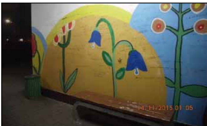
Dvojice dívek neslušně popsala zeď a poškodila lavičku.

Dne 13. listopadu ve večerních hodinách zjistila hlídka při kontrolní činnosti poškození zdi, lavičky a dlažby na autobusovém nádraží. Na zdi na ploše 3 x 5 metrů se nacházelo velké množství neslušných až vulgárních nápisů. Pomalována byla i lavička a zámková dlažba. Kamera snímající tento prostor odhalila šokující zjištění. Ze záznamu je patrné, že poškození má na svědomí dvojice dívek vytvářejících toto nechutné dílo v uvedený den v době od 19:00 do 21:00 hodin. Pro důvodné podezření ze spáchání trestného činu poškození cizí věci formou sprejerství dle §257b trestního zákona, byla věc předána policii ČR.