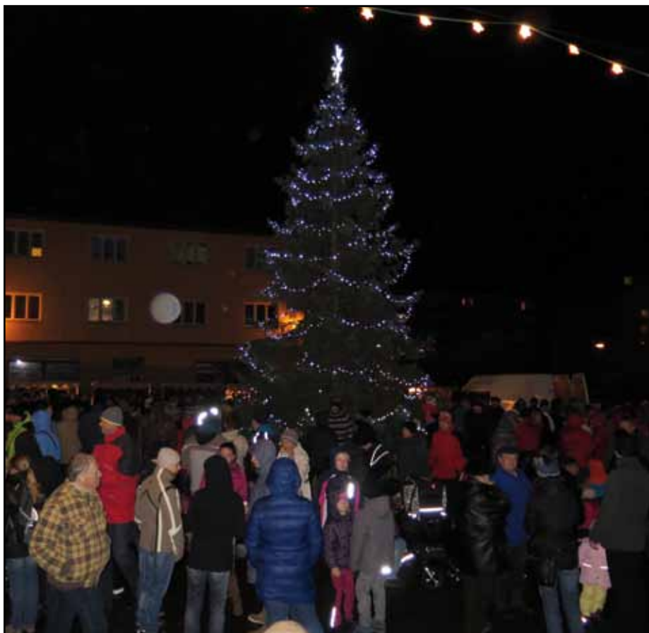
Na rozsvícení vánočního stromu se přišlo na nýrské náměstí podívat mnoho lidí.