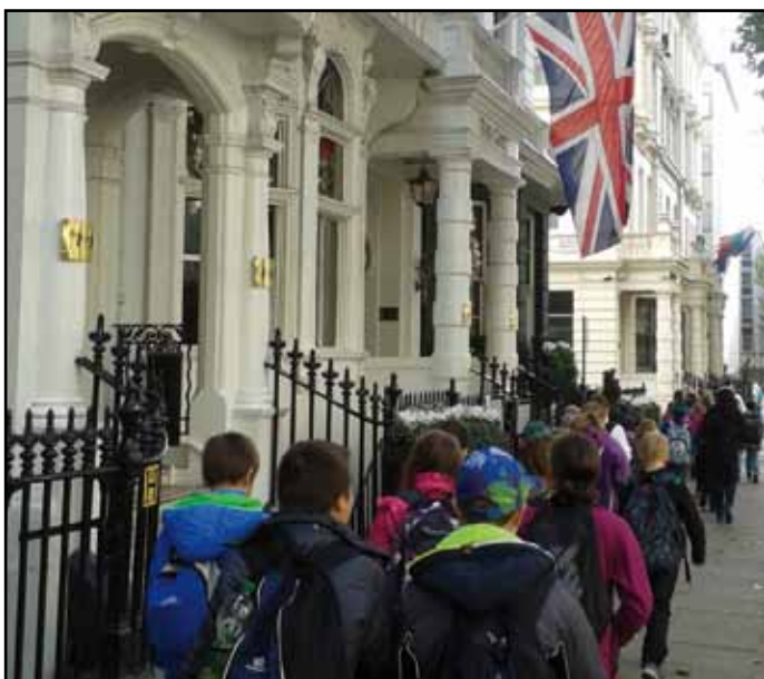
Po stopách anglické kultury.