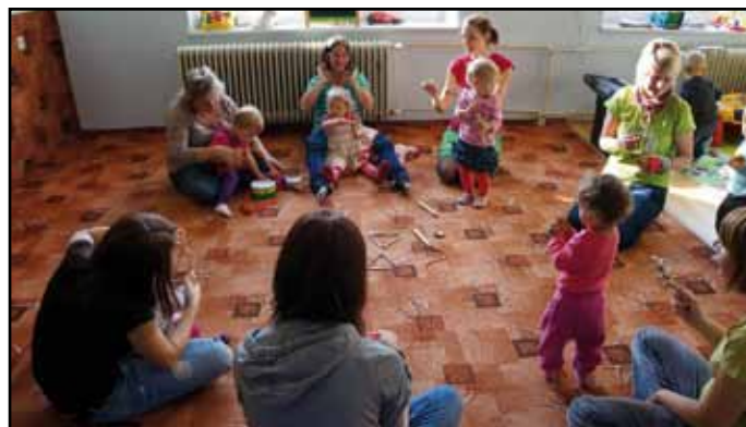
Aktivity v „Klubíčku“.

V úterý můžete s dětmi přijít na pohybové cvičení s říkankami. Stejný den bude probíhat i výtvarníček pro všechny, kteří rádi malují a tvoří z různých materiálů.