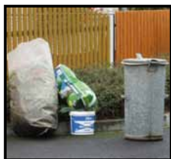
Skládky bioodpadu do ulic nepatří!

Pozorný čtenář si jistě všiml, že nikde není v článku uvedeno, že je povoleno znečišťovat veřejná prostranství ukládáním bioodpadu. Nevzhledné hromady hnijících jablek, trávy a dalšího odpadu nejen hyzdí ulice, ale i ničí travnaté plochy. Tento nešvar se v letošním roce velice rozšířil a neúměrně zvyšuje náklady v rozpočtu technických služeb. Zároveň je tento postup likvidace bioodpadu porušováním městské vyhlášky. Přestože jsme na problematiku upozorňovali v NN v průběhu roku, situace se nezlepšila, spíše naopak. Tento stav bude tolerován do konce letošního roku. V roce příštím se strážníci městské policie zaměří na tuto problematiku a za znečištění prostranství bioodpadem budou ukládat pokuty. (MěÚ)