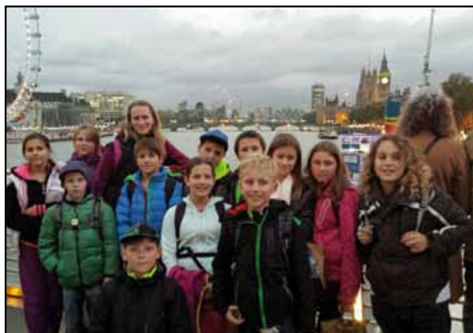
Účastníci zahraničního pobytu v Londýně.

Po dopolední výuce se vydávali za historií a kulturou Anglie na zajímavá místa jako je Sherborne Castle, Stonehenge, katedrála v Salisbury, historické doky v Portsmouth s prohlídkou lodi Jejího Veličenstva Victory (vítězná loď kapitána Nelsona z bitvy u Trafalgaru), bournemou-