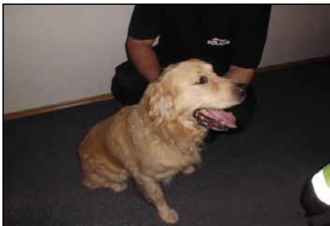
22. října byl městské policii předán pes, který se toulal v areálu podniku Okula. Pes byl umístěn do psiho útulku „Bobik“ v Milencích.