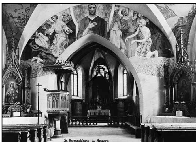
Interiér kostela na dobových fotografiích.