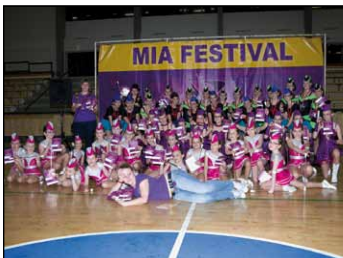
Padesát čtyři mažoretek a jejich rodinní příslušníci tvoří velké delegace, které bezvadně propagují naše město.