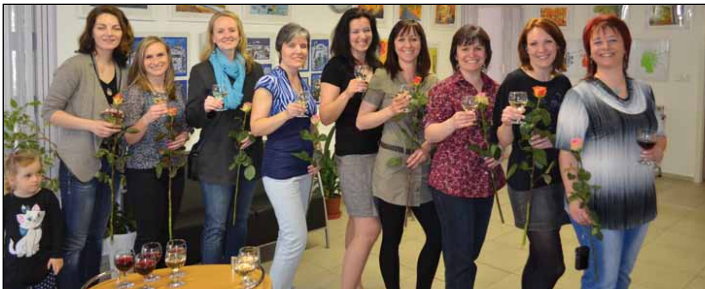
Účastnice kurzu Kreslení pro radost .

Třetí týden v září loňského roku se poprvé sešly účastnice kurzu v sále městské knihovny na první hodiny kreslení. Zakřiknuté, nejisté a v oblasti kreslení nesebevědomé.