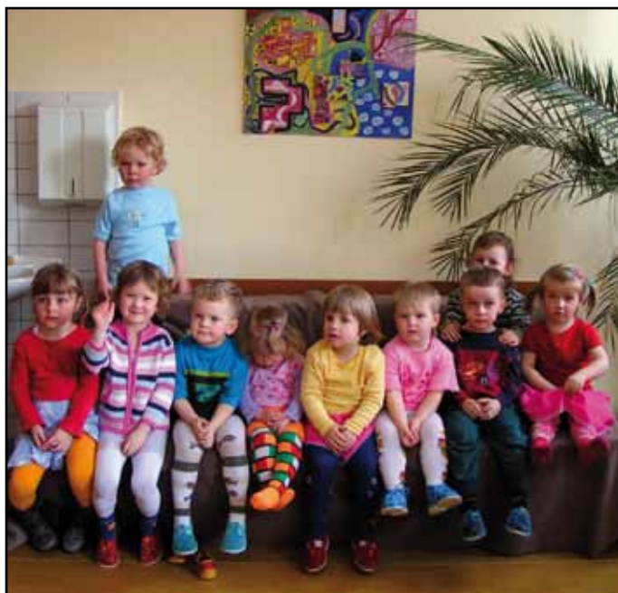
Děti na fotografii už nepatří mezi nejmladší. Najdou se na ní tehdejší malá „Sluníčka“?