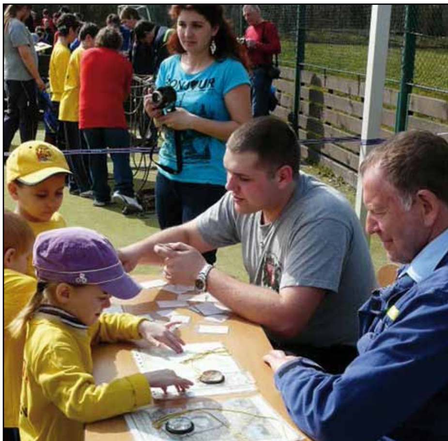
Na dubnové hasičské „Jarní soutěži dětí“ mali účastníci také určovali topografické značky.