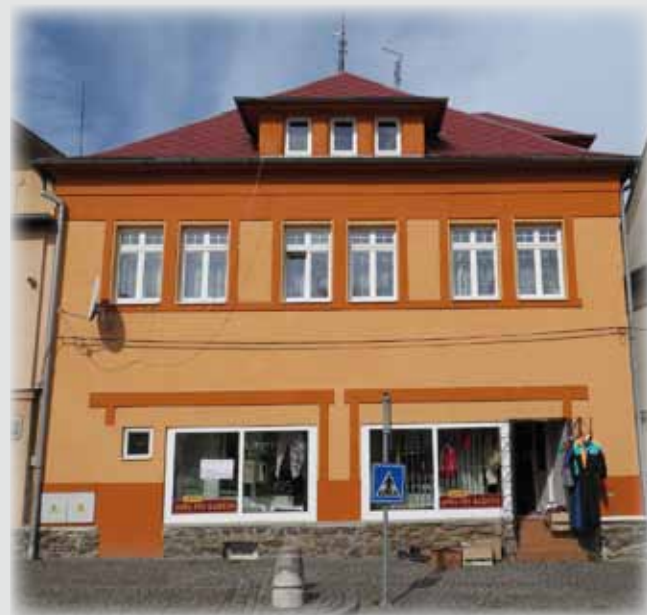
Křižíkova ulice a dům čp. 160 dříve a nyní.