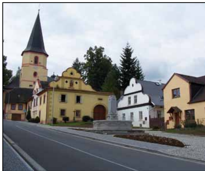
Kostel sv. Tomáše.