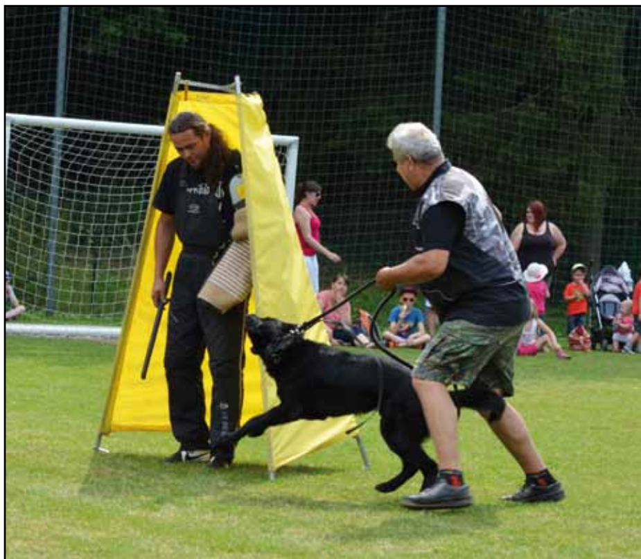
Zadržení pachatele při ukázce výcviku psů v podání členů Kynologického klubu Nýrsko.