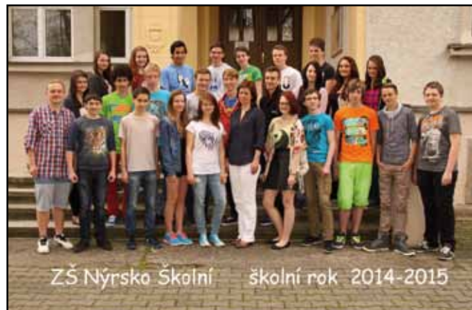
Základní škola Nýrsko, Školní ulice