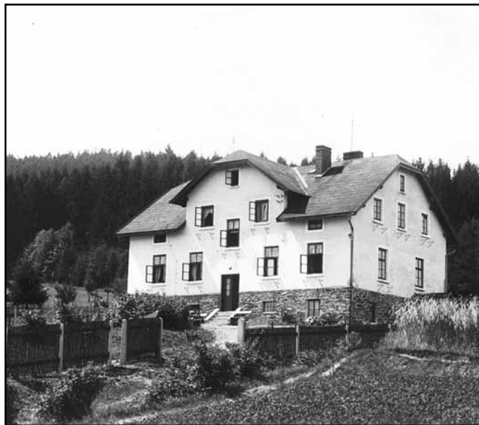
Vila „Klásterka“ pod Pajrekem.