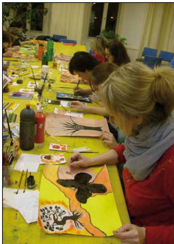
Zdokonalit se v malování může každý.