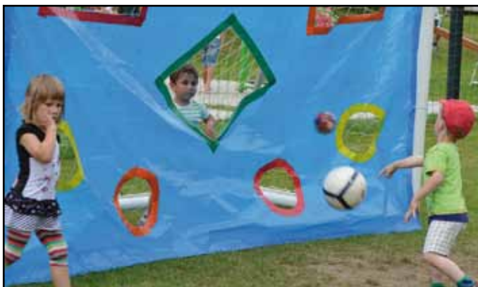
Děti si připravené soutěže pěkně užily.

Po úkloně malému a vděčnému dětskému publiku se herci zamáváním rozloučili a program pokračoval rozprchnutím všech dětí k jednotlivým aktivitám připraveným po celé ploše. Na jedné straně na ně číhal známý zábavný Twister, ve kterém není nouzi o smích a různé padačky dolů ze zamotaných paží, rukou, nohou, celých těl... No prostě je to dřina, ale zároveň legrace, jakou naši špuntíci v tomhle věku opravdu milují. V jiných místech na ně už čekala napnutá plachta přes celou fotbalovou bránu, obrovská, lesklá, modrá plachta s několika barevně orámovanými otvory, kam házely děti míče různých velikostí. Blízko fotbalové brány se děti snažily strefit dvojmičkem svázaným provázkem na barevný stojací minižebřík. Zdálo se, že to pro ně nebylo úplně jednoduché. Svoji šikovnost a obratnost mohly děti vyzkoušet na překážkové dráze. Na trávě měly rozložené pěnové puzzle, které zabavily ty z mladší kategorie věku dětí, a souběžně s aktivitami a hrami si děti dychtivě nechávaly pomalovat obličej krásnými, pestrými barvami a lesklými třpytkami... Když se děti dostatečně vydováděly kolem her a aktivit, nastal čas se trochu uklidnit a to se podařilo při ukázce výcviku psů. Děti se shromáždily na fotbalovém hřišti, kde členové Kynologického klubu Nýrsko předvedli několik ukázek kolem napínavého zadržení pachatele psem. K dokreslení atmosféry zazněly i skutečné výstřely ze zbraně.