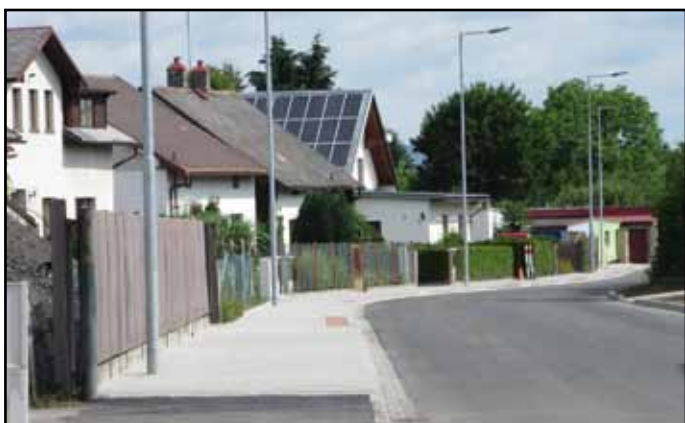
Chodská ulice po rekonstrukci.