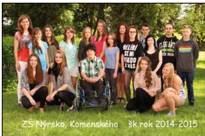
Základní škola Nýrsko, Komenského ulice

Příspěvky do Nýrských novin zasílejte na e-mail: nyrskenoviny@gmail.com