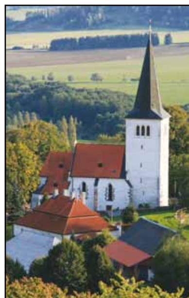
Gotický kostel v Loučimi.

Gotický kostel Narození Panny Marie je nejvýznamnější památkou obce. Vznikl zřejmě v první po-