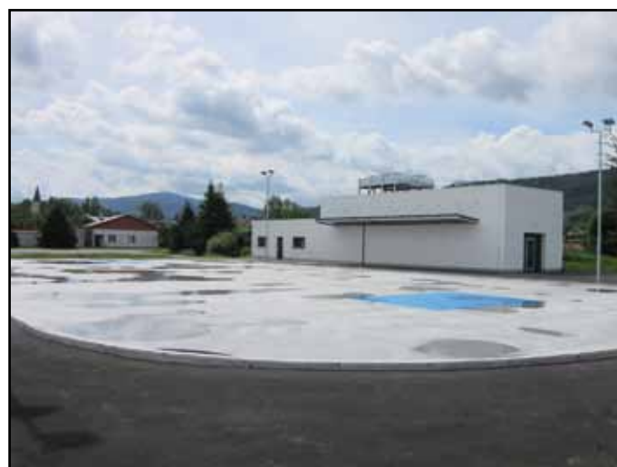
Ledová plocha bude využívána pro sportování nejen v zimě.

Firma ASEKOL a.s., která zajišťuje i na území města Nýrska zpětný odběr vyřazených elektrozařízení a jejich následnou recyklaci, každoročně sleduje a vyhodnocuje podíl občanů našeho města na recyklaci použitých elektrospotřebičů. V roce 2014 bylo na území města odevzdáno 226 televizí, 63 monitorů a 2 420 kg drobného elektrického odpadu. Přepočtem je stanoveno, že výše uvedené množství odevzdaných elektrospotřebičů ušetřilo 103,11 MWh elektřiny, 5 011 litrů ropy (cca 73 700 ujetých km v běžném autě), 451 m 3 vody (cca 6050 sprchování) a 4 tuny primárních surovin. Z výše uvedeného je zřejmé, že zpětný odběr elektrozařízení (i těch nejmenších) má nezanedbatelný pozitivní dopad na životní prostředí. (MěÚ)