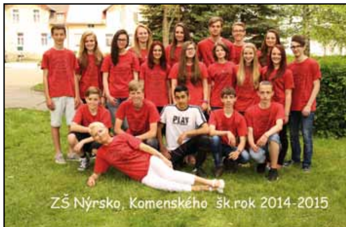
Základní škola Nýrsko, Komenského ulice