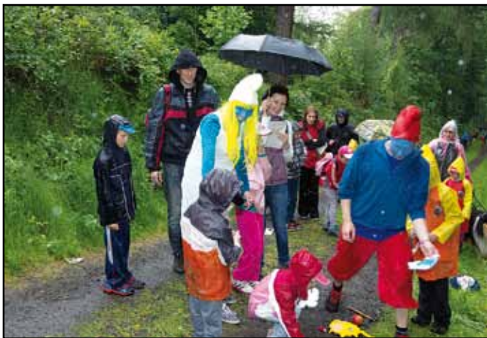
Pohádkový les déšť nepřekazil.