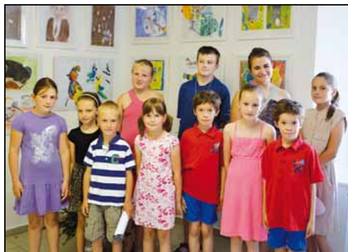
Malí kreslíři na vernisáži.

Dne 13. 6. v 16:00 hodin zaplnilo sál knihovny mnoho návštěvníků a milovníků umění. Po krátkém představení všech malířů si všichni s údivem a ústy otevřenými překvapením mohli prohlížet nádherné a skvostné kresby dětí, kterým je v rozmezí od pěti do dvanácti let. Jsou prostě úžasné, jsou skvělé a jsou to báječní malíři. I vy se o tom můžete přesvědčit až do 28. 8. Do této doby je výstava přístupná v otevíracích hodinách knihovny.