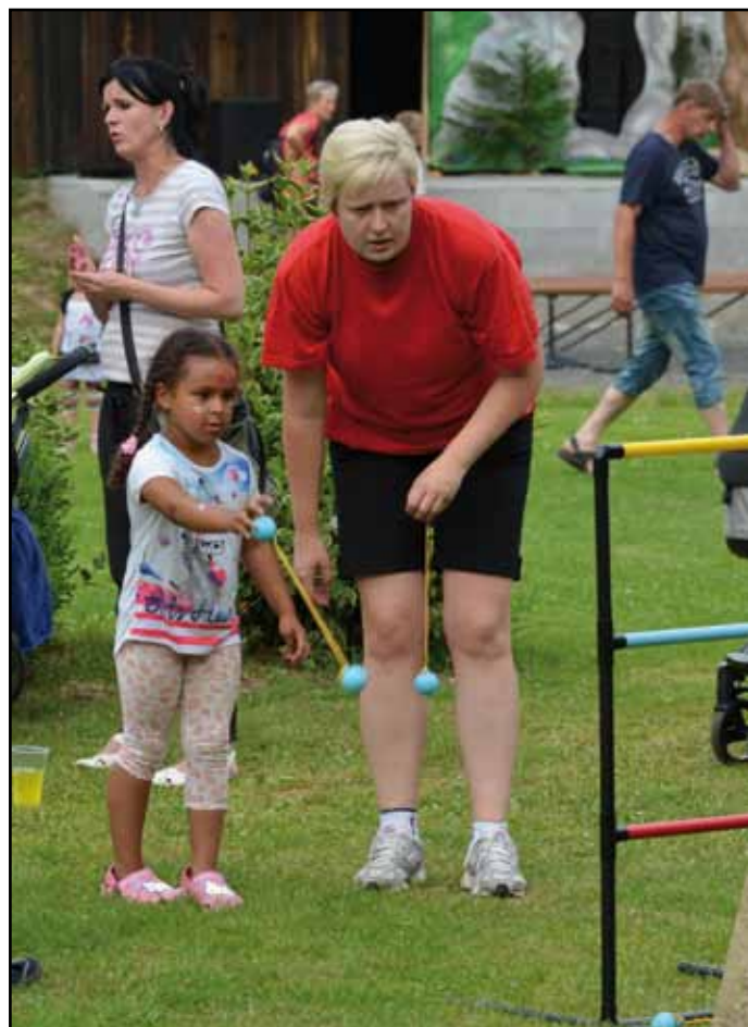
Z připravených aktivit.

No prostě celé odpoledne nás všechny obdařilo sluníčkem bez mráček a děti se svojí euforií, jakou dokáží mít jen ony, nás na oplátku obdarovaly spokojenými, rozzářenými kukadly. A o to nám přece šlo. Abychom se potěšili tím, že jsou naši školáčkové, školáci a předškoláci trochu odměněni hrou a společnou zábavou za jejich snažení a celoroční práci ve škole. A k tomu jim ještě hodní rodiče, po zhlédnutí závěrečného krátkého divadelního představení místního ochotnického spolku „Kord v srdci“, opekli buřtíky na ohýnku. Byla to pohoda, jaká k takovému poslednímu školnímu a předprázdninovému dni patří. Když se povede. A ten náš se díky všem pracovníkům městské knihovny, TJ Nýrsko a nadšeným dobrovolníkům, myslíme, opravdu povedl. A samozřejmě díky vám všem. Akce se zúčastnilo asi 320 zájemců. Mějte krásné prázdniny a těšíme se na vás u nějaké fajn akce, jako byla tahle.