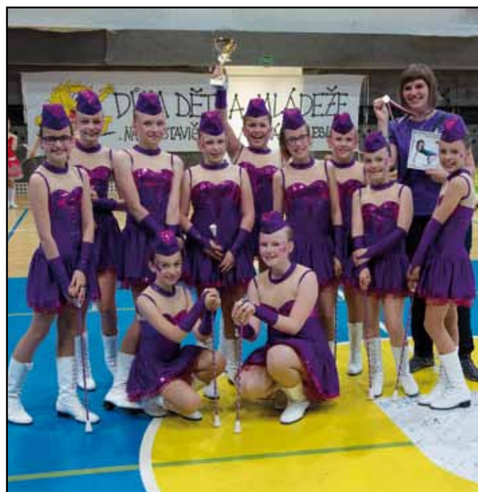
Mažoretky z Ametystu uspěly v Mladé Boleslavi.