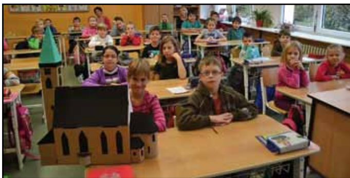
Výuka v rámci projektového dne.

Vzpomínkou na dětství a zároveň jakousi zkouškou kreativity, manuální zručnosti i vzájemné spolupráce se stal úkol postavit co nejvyšší a nejzajímavější věž z netradičního stavebního materiálu (plastových kelímků, minikelímků, pivních táček a malých plastových kostiček). A kdo zvítězil? Samozřejmě naši nejstarší devátáci, kteří prokázali skutečného tvůrčího ducha a zvítězili nejrychlejším časem a originalitou stavby.