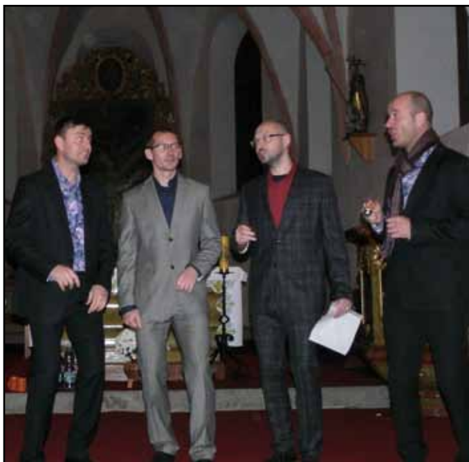
Z vystoupení skupiny Hlasoplet.

Báječný koncert skupiny Hlasoplet si mohli posluchači vyslechnout ve čtvrtek 13. listopadu 2014 v Kostele svatého Tomáše v Nýrsku. Vystoupení proběhlo v rámci festivalu „Jazz bez hranic“.