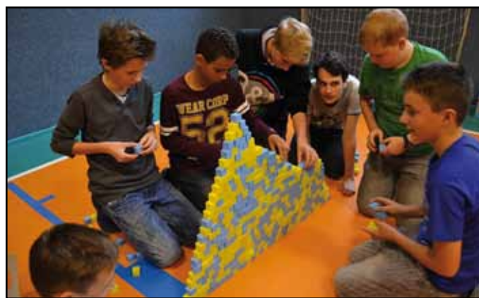
Žáci stavěli netradiční věže.