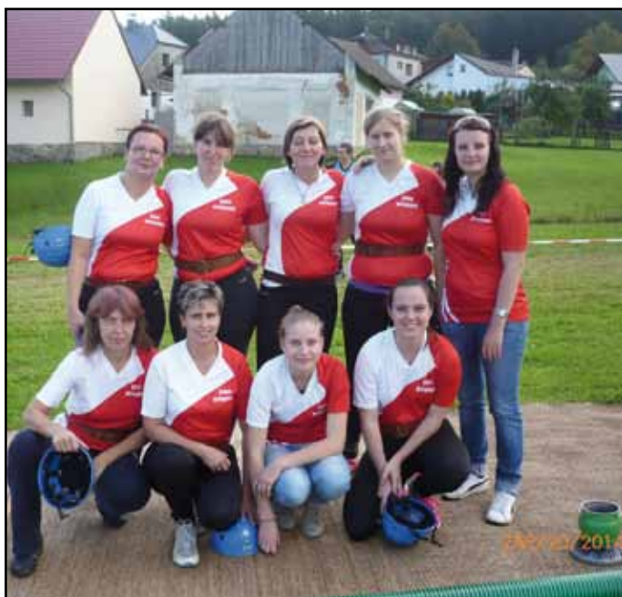
Letošní rok byl pro družstvo žen úspěšný.