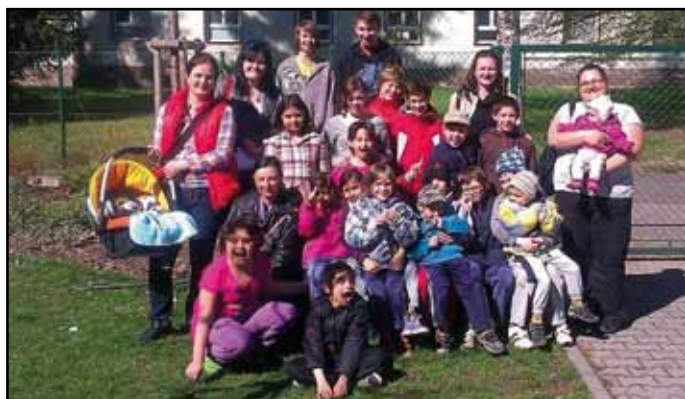
Děti z Klokánku v Janovicích nad Úhlavou.