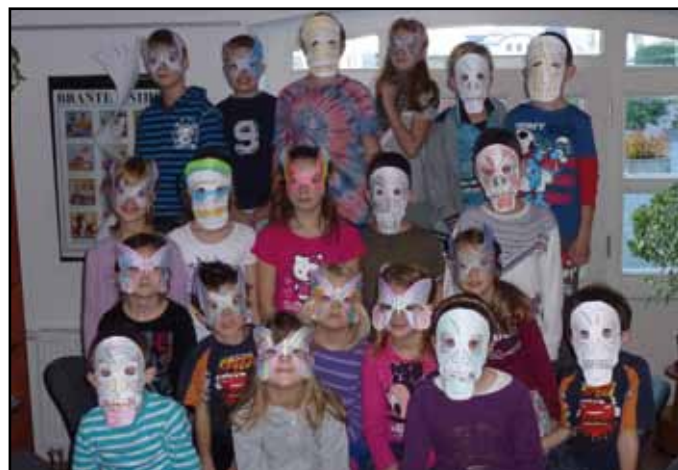
Nocování v knihovně si děti užily.

Ale aby toho nebylo málo, hned po snídani jsme se pustili do výroby slizu. Tohle byla pro děti asi ta nejzábavnější i nejobdivivější část celého nocování v knihovně. Po-