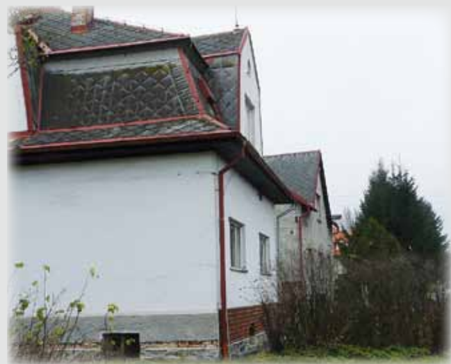
Proměna rodinné vilky v Klatovské ulici – v roce 1900 a nyní.

Uzávěrka pro zaslání příspěvků do dalšího čísla je 20. prosince.