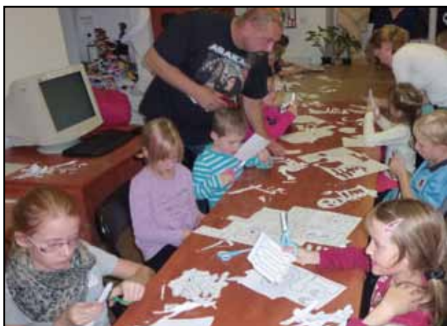
Děti si vytvořily strašidelné masky.