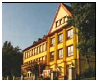
Bývalá škola v Děpolticích, která dnes slouží jako penzion.

První zmínka o Děpolticích je v pramenech z roku 1379. Byly vsí občanů Děpoltových, přičemž Děpoltů najdeme ještě v kalendáři ze šedesátých let 20. století. Součástí Děpoltic jsou Oldřichovice. Zápis o nich máme z roku 1383, kdy jsou zaznamenány jako „Ulrichowicz“.