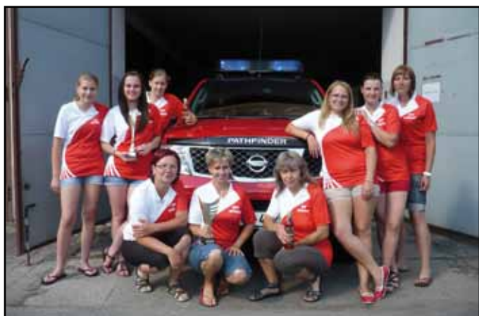
Družstvo žen u hasičské techniky.

PHL je rozdělena do dvanácti kol. Každé kolo pořádá jiné město či obec a první se tradičně pořádá v Habartících. V letošním roce se našemu ženskému týmu povedlo zúčastnit se všech dvanácti kol – byly to již zmíněné Habartice, Sušice, Týnec u Horažďovic, Luby, Defurovy Lažany, Rozsedly, Janovice, Nýrsko, Slavošovice, Strážov, Malá Víska a závěr letos padl na Tupadly. Všechny body ze soutěží se sčítají a body za dvě nejhorší umístění se na konci odečtou. Trošku nelogické, ale bohužel pravidla jsou pravidla.