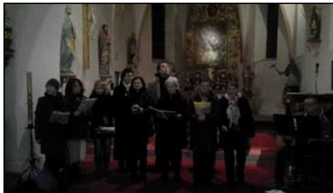
Pěvecký sbor Schola sv. Tomáše.