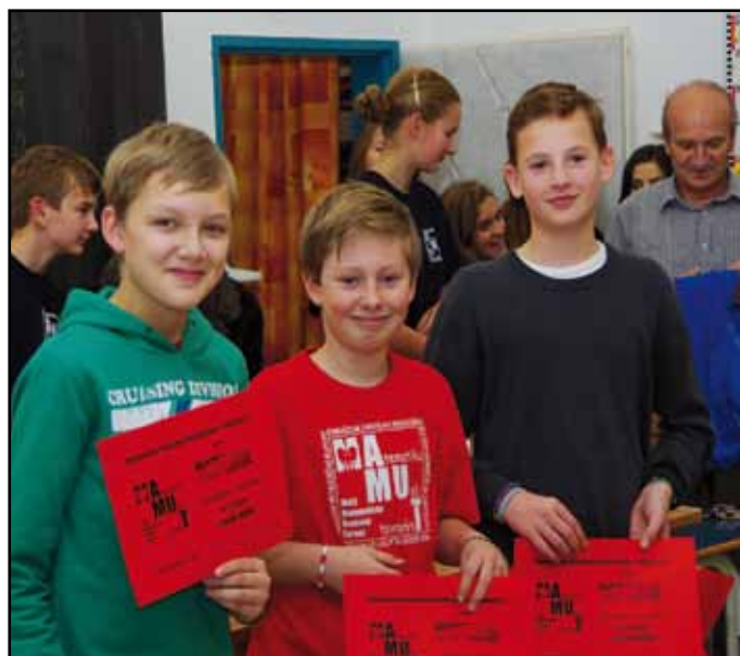
Trojčlenné družstvo z Nýrska uspělo v okresní soutěži.