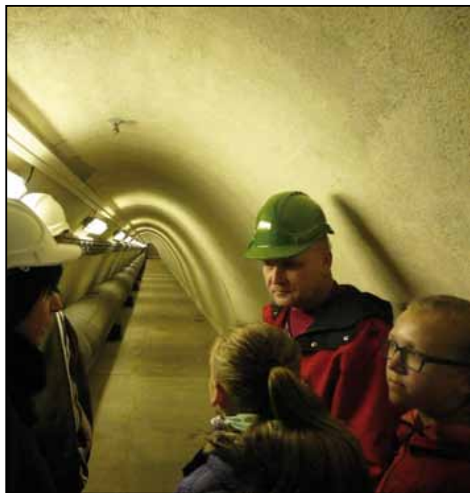
Návštěva v podzemí přehrady.