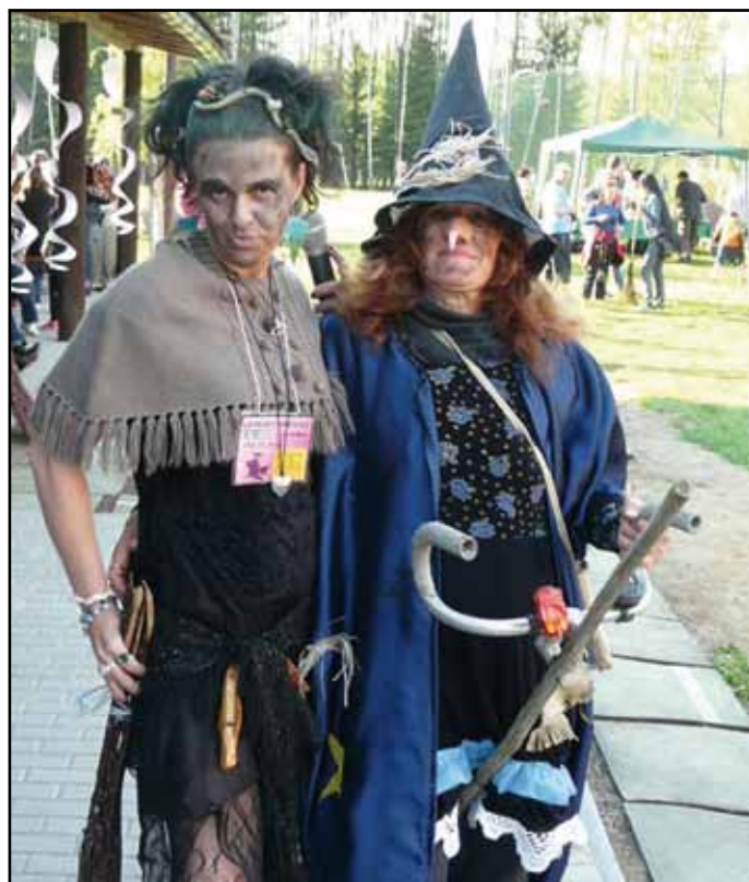
O čarodějnice nebyla ani letos nouze.

Poslední noc v dubnu je spojována se stavěním májky a upalováním čarodějnic. Na mnoha místech naší země se rozhoří ohně. Naši předci však přisuzovali této noci magickou moc. V tuto dobu měly „zlé síly“ největší moc, a proto se lidé snažili ochránit sebe i majetek a případně i zvířectvo. Proto ty ohně, které měly tyto síly zahnat pryč. Na některých místech se místo čarodějnice pálí Morana, zosobnění zimy. Jejím spálením vlastně končíme zimu a špatné počasí a po ní k nám přichází jaro. Symbolem jara je vlastně nazdobená májka.