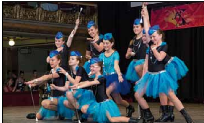
Členky kroužku mažoretek DDM na celostátním finále „MIA Festivalu“.

Dům dětí a mládeže Nýrsko zve nejen MLADÉ od 15 let do