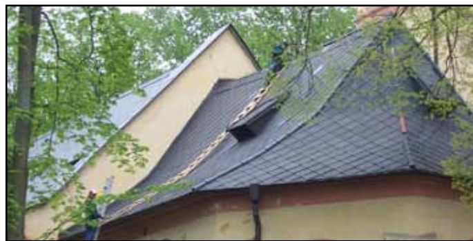
Oprava střechy nýrského kostela.

Na 18. veřejném zasedání zastupitelstva města bylo vyhlášeno výběrové řízení na poskytnutí dotace ve výši 1 mil. Kč na zajištění činnosti sportovních a zájmových organizací, dotace se vztahuje také na vybrané kulturní akce. Ve stanoveném termínu bylo podáno 23 žádostí v celkové částce 1 085 363,- Kč. Starostou jmenovaná komise žádosti posoudila a předložila návrh na poskytnutí dotací ve výši 959 000,- Kč, které jsou určeny na údržbu nemovitostí, na zajištění pravidelné činnosti, na jednorázovou reprezentaci města v ČR a v zahraničí, dále pak na granty při pořádání výstav a divadelních představení. (MěÚ)