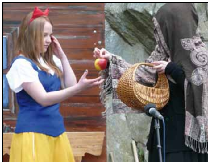
„Sněhurka“ z roku 2011.

Pokud jste nestihli květnové představení, zajděte do Lesního divadla na konci prázdnin. 31. srpna 2014 se totiž koná repríza. A pokud nebudete chtít čekat tak dlouho, 22. června vám zahrají členové nýrského dětského spolku pohádku „Princezna ze mlejna“. Nebo navštivte hry ochotnických spolků z jiných obcí. Každých čtrnáct dní po celé léto na vás čeká další představení. Jste srdečně zváni.