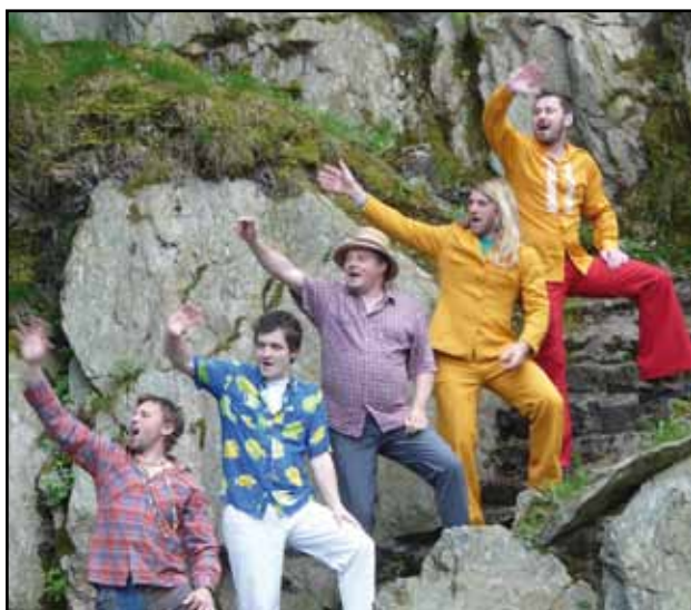
„C'est la vie“ z roku 2012.