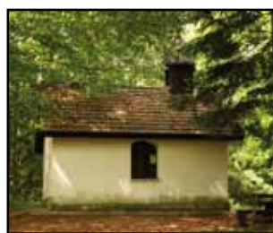
„Medvědí“ kaple sv. Bernarda u Liščí.