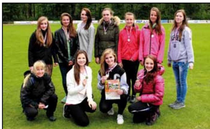
Starší žákyně po úspěchu v atletické soutěži.