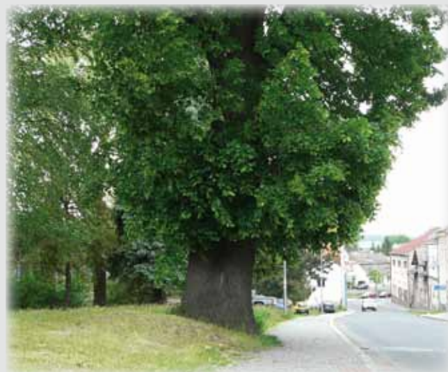
Klostermannova ulice od kostela k Okule v minulosti a dnes.

Uzávěrka pro zaslání příspěvků do dalšího čísla je 20. června.