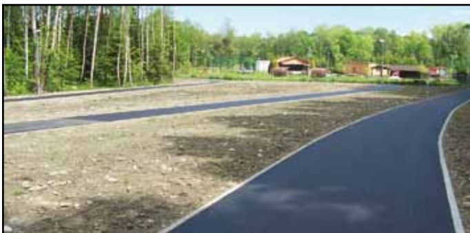
Nová in-line dráha se zázemím.