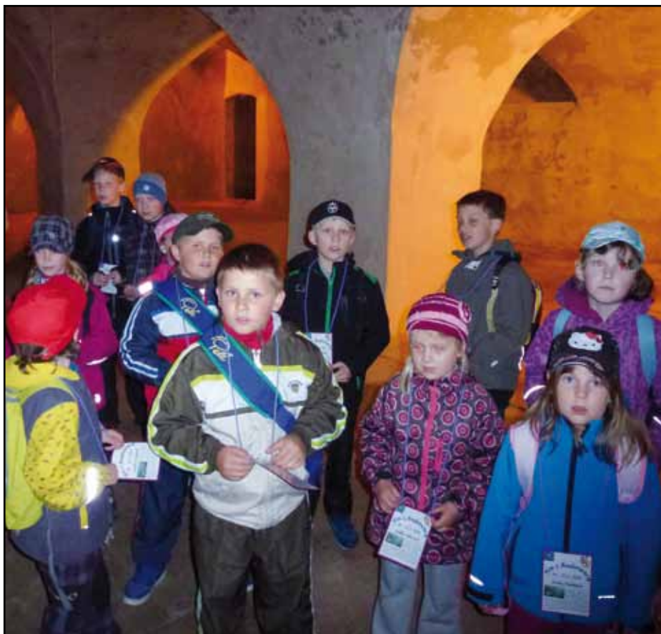
Děti se v rámci „Noci s Andersenem“, kterou pořádá městská knihovna, podívaly i do sklepení dešenické tvrze.