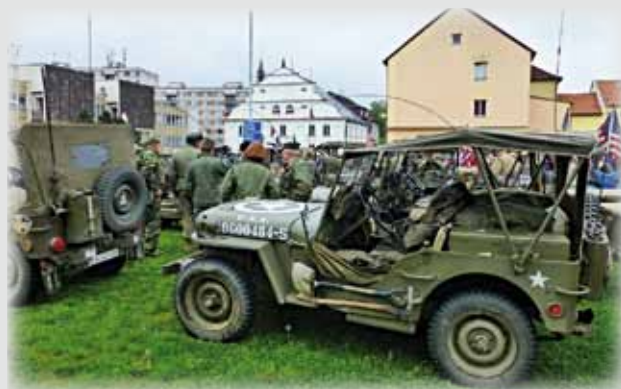
Oslavy osvobození v Nýrsku 2. května objektivem čtenáře Nýrských novin. (MĚŮ)