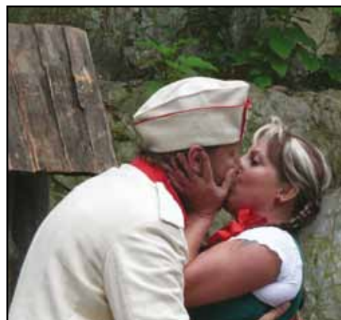
Nýrští ochotníci při vystoupení 2. 7. 2011 - pohádka Hrátky s čertem .