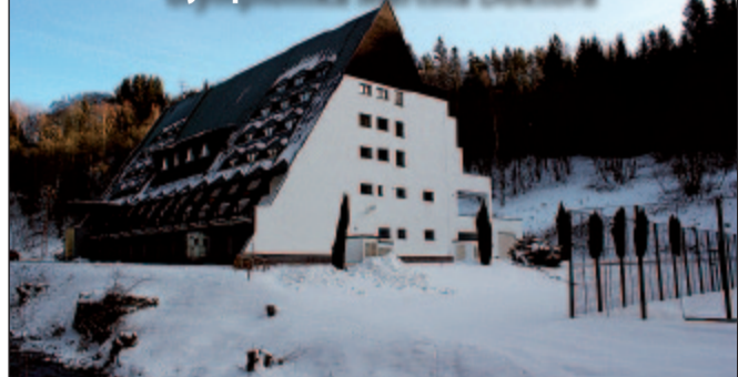
Wellness & Sporthotel Šumava.

Weellness & Sport hotel Šumava přivítal olympionika Martina Doktora