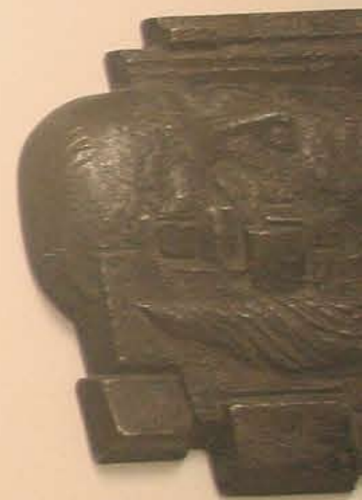
Karel IV. / 1987