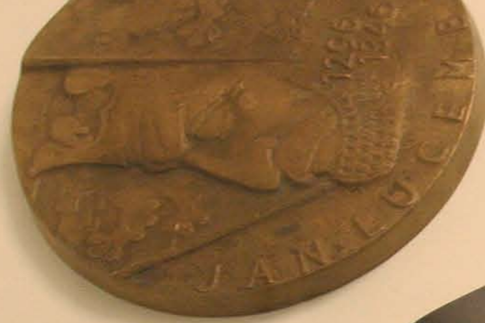
Jan Lucemburský / 1980

Pokud budete číst pozorně, nebudete pro vás těžké odpovědět, co to je: a) kolana insignie perz