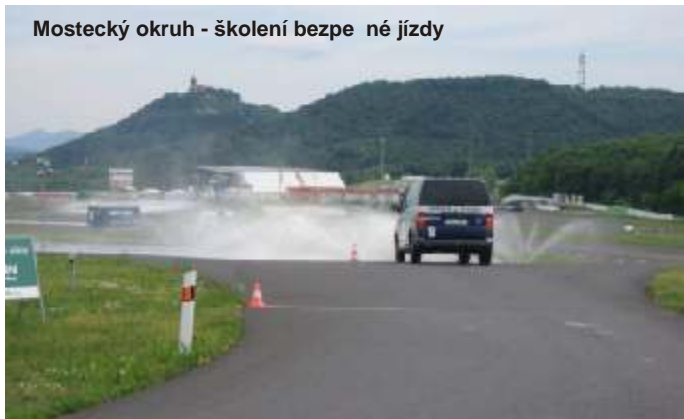
Mostecký okruh - školení bezpečné jízdy

Vážení tenáři, po měsíci se opět setkáváme na stránkách Železnorudského zpravodaje, na kterých vás chceme informovat o práci záchranné Horské služby na Šumavu.