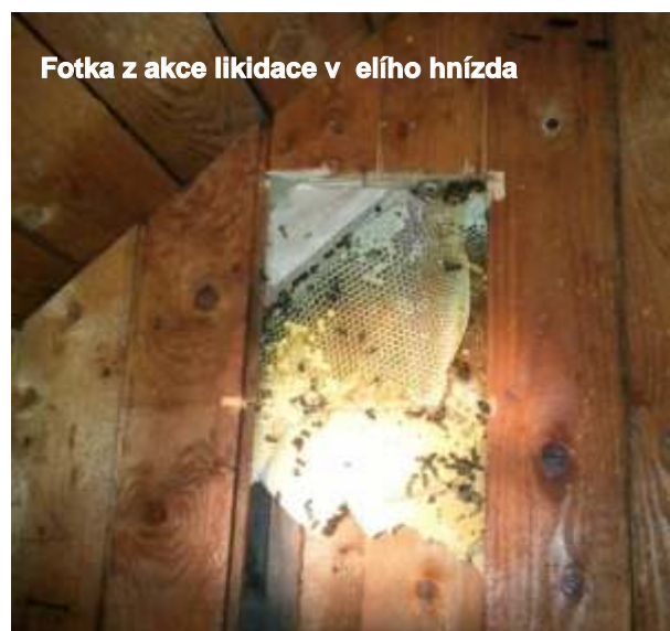
Fotka z akce likvidace v elího hnízda