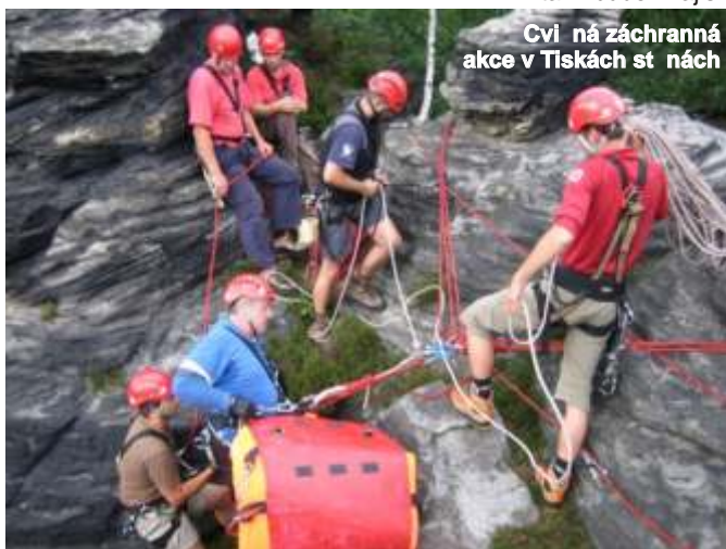
Cvičení záchranné akce v Tiskách stánách

1. července začaly letní prázdniny a pro Horskou službu začala hlavní letní sezóna. Šumavu každoročně navštíví tisíce turistů a velké množství turistů přináší i mnoho práce pro záchrannou Horskou službu. Horská služba tak bude zajišťovat záchranné práce ve