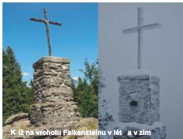
Kříž na vrcholu Falkensteinu v létě a v zimě