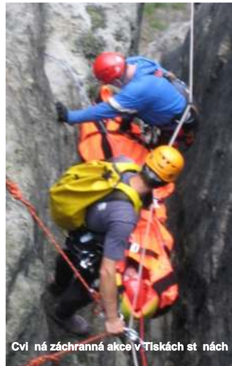
Cvičení záchranné akce v Tiskách stánách

Před zahájením letní sezóny obdržela Horská služba Šumava také dotaci Jihočeského krajského úřadu ve výši 110 000,- Kč. Finance jsme použili na nákup zdravotnického