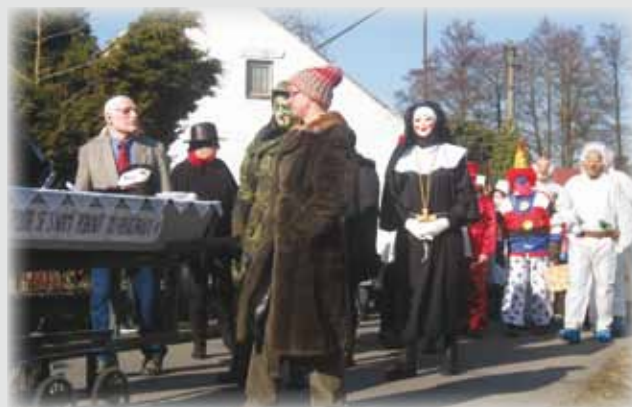
V loňském masopustním průvodu bylo pěkně veselo a k vidění bylo velké množství masek.