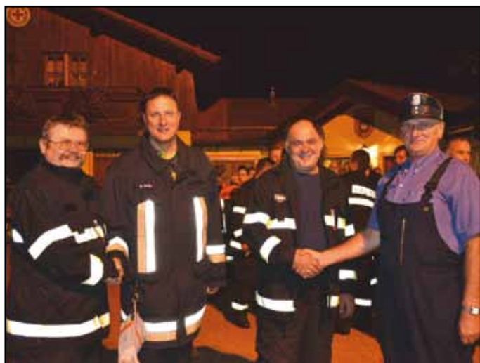
Nýrští hasiči s německými kolegy.

Mimo běžný výcvik dále pokračuje naše spolupráce s hasiči z německého Neukirchenu. V loňském roce proběhlo společné cvičení u našich sousedů s námětem požáru staré fary. Jednalo se o perfektně připravené cvičení, kterého se kromě nás zúčastnilo dalších 11 sborů z Německa (z tohoto cvičení pochází i fotografie).