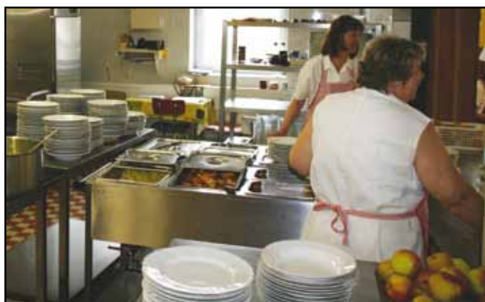
Výdej obědů ve školní jídelně.