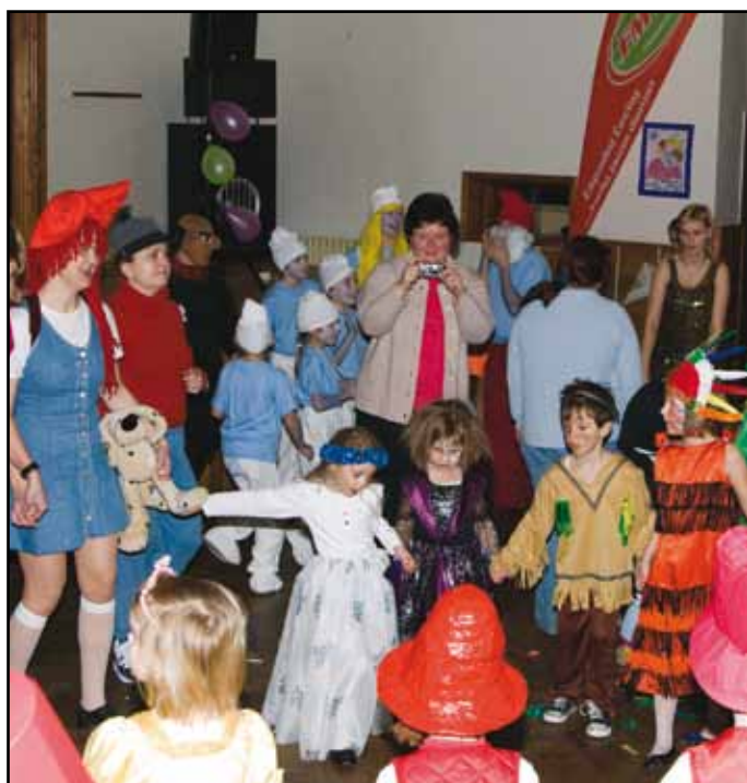
Z loňského maškarního karnevalu DDM Nýrsko.