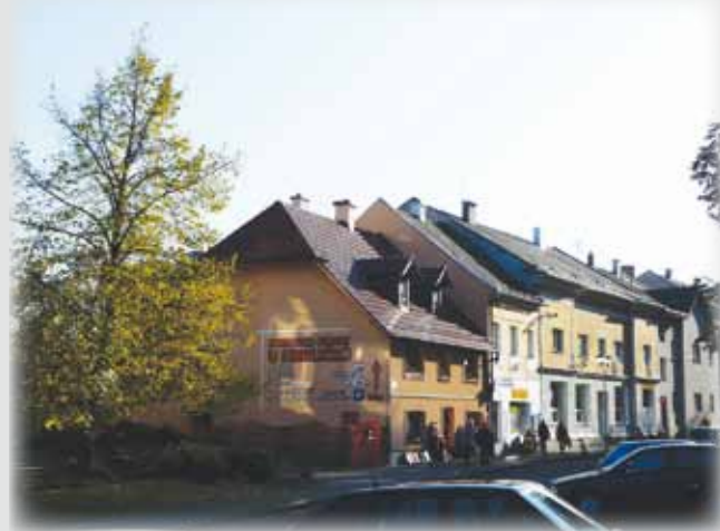
Ulice Prap. Veitla dříve a dnes.

Příspěvky do Nýrských novin zasílejte na e-mail: nyrskenoviny@gmail.com