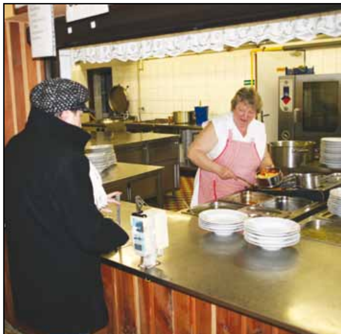
Ze školní jídelny.

V souvislosti s novelou školského zákona, tedy podle zákona č. 472/2011 Sb., bod 47., se do § 119 vkládá věta: „Zařízení školního stravování mohou poskytovat školní stravování také v době školních prázdnin.“ Tato úprava umožňuje nabídnout stravování (oběd) v naší školní jídelně všem zájemcům – žákům i v průběhu všech školních prázdnin (poletní, jarní, velikonoční, hlavní, podzimní, vánoční) za stávající ceny. Jedinou podmínkou je řádné přihlášení (i výběr) oběda buď prostřednictvím terminálu v jídelně, nebo telefonicky u vedoucí školní jídelny. Obědy o prázdninách budou vydávány v pozmeněném čase, tj. od 11.00 do 12.30 hodin. Nepřihlášení žáci budou automaticky ze stravování v období prázdnin vyřazováni.