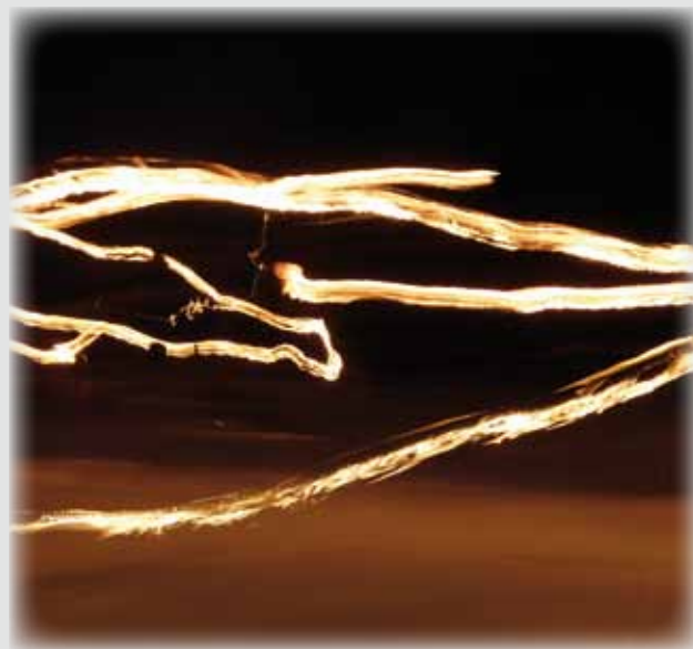
Ve tmě se sjíždějící lyžaři změnil pro objektiv fotoaparátu jen v dlouhé žhavé čáry, které zanechávaly hořící pochodně.