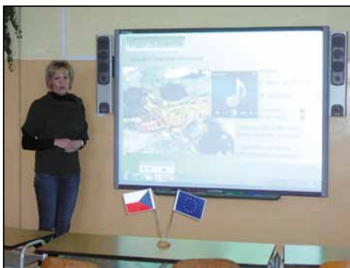
Využití interaktivní tabule.

Listopad byl zajímavý především pro pedagogické pracovníky. Součástí projektu „Šumavská škola = evropská škola“ financovaného z prostředků ESF byl 1. workshop (tvůrčí dílna), jehož hlavním smyslem bylo ukázat první tvůrčí práce realizačního týmu. Zúčastnění pedagogičtí pracovníci tak postupně viděli využití interaktivní tabule ve výuce českého jazyka a prvouky na 1. stupni ZŠ, anglického jazyka, matematiky, přírodopisu, chemie na 2. stupni ZŠ a výukové prezentace k učivu Moderní populární hudba v hudební výchově 9. ročníku. Atmosféra byla pracovní, ale zároveň velmi příjemná – všichni přítomní pozorně sledovali předváděné výukové moduly a každý tvůrce byl odměněn zaslouženým potleskem. Pedagogičtí pracovníci neúčastníci se projektu mohli získat cenné informace a zkušenosti a posoudit smysl využití interaktivní tabule ve výuce.