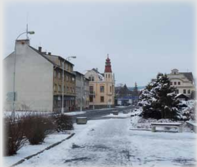
Filiální kostel Čtrnácti svatých pomocníků na nýrském náměstí, který byl zbourán ve druhé polovině 20. století. Náměstí v současné době.