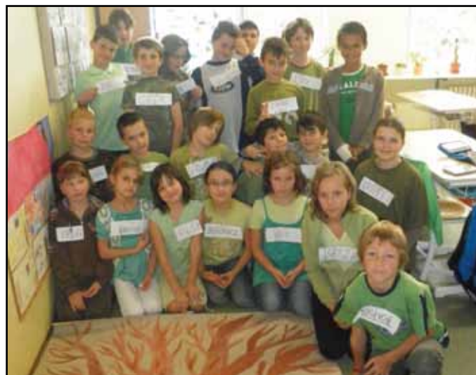
Z projektového dne „LES“ podruhé.