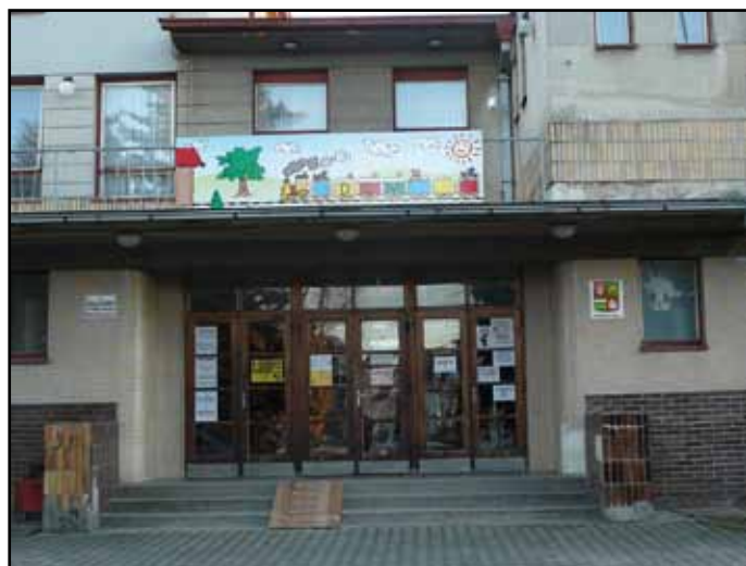
Hlavní vchod do kulturního domu s logem DDM.

Ne, to všechno zůstává. Občané nemusí mít strach, že kulturní dům využijeme pouze pro sebe, naopak. Během roku proběhne několik tanečních zábav, už máme dohodnutý termín se skupinou Kečup, plesy budou probíhat dle dohody, stejně jako kulturní představení nebo vystoupení pro školy a školky tak, jak bylo zvykem. Pro organizace a spolky ve městě se nic nemění, snad jen to, že je potřeba se domlouvat s námi. Zájemci mají i nadále možnost si při těchto akcích vydělat nějakou korunu na činnost svých organizací. Takže se peníze zase určitým způsobem vra-