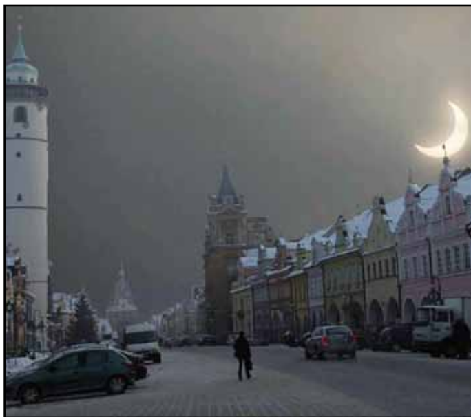
Zatmění slunce v Domažlicích.

V úterý 4. ledna 2011 mohli pozorovatelé i v našem městě vidět na obloze jev, který není zas tak častý – částečné zatmění slunce. Šlo o největší částečné zatmění po osmi letech v České republice. Počasí nám bylo docela nakloněno, takže jsme jej mohli celkem dobře vidět. Měsíc ve fázi novu zakryl slunce asi ze 79%.