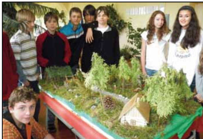
Z projektového dne „LES“.

V měsíci říjnu se nejzajímavější akcí školy stal projektový den LES, který se konal 26. 10. 2010. Byl plánovanou aktivitou celoročního projektu „LES – Lidé, Ekologie, Stromy“ a jeho cílem bylo nejen obecné seznámení s ekosystémem lesa, ale konkrétně s nejbližší lesní oblastí Šumavou a dále s ekologickým chováním v lese. Žáci se v průběhu tohoto dne zúčastnili besedy o Šumavě (Mgr. D. Hirič), filmové projekce a tvořivého učení se svými třídními učiteli. V závěru žáci 1. stupně tvořili svůj třídní „strom“ a žáci 2. stupně se pochlubili prezentací svých projektů s danou tematikou LES. Velmi kvalitní byly nejen předvedené projekty, ale i jejich originální uvedení a „obhajoba“ samotnými žáky.