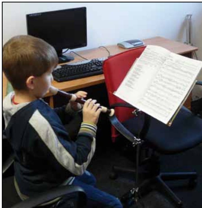
V nových prostorách zní také hudba v podání budoucích muzikantů.

O vánočních prázdninách jsme opustili budovu v Husově ulici, kde jsme do té doby sídlili, a přestěhovali se do prostor kulturního domu. Moc děkujeme za pomoc rodičům dětí, přátelům, kamarádům, našim rodinám, firmě Lesní stavby za poskytnutí nákladního automobilu na převoz zařízení a další pomoc, MUDr. Urbánkovi, který nám věnoval vybavení jeho čekárny, takže rodiče, kteří budou čekat na děti až jim skončí nějaký kroužek, nebudou muset ve vestibulu postávat. Samozřejmě nesmím zapomenout ani na další hodné spoluobčany, kteří nám darovali vybavení do kluboven, hračky pro děti a třeba i květiny, které nám prostory zútulnily. Musíme také poděkovat zástupcům města Nýrska, kteří nám přislíbili finanční pomoc při platbě energií, protože je potřeba vytápět celý objekt. Vzhledem k tomu, že jej využíváme opravdu kompletně, musíme mít všude teplo. Ještě jednou díky všem, bez nichž bychom to nedokázali. Kulturní dům využíváme celý, všechny klubovny, tělocvičnu i sál. A nejen využíváme, ale o celý objekt se i staráme. Snažíme se vše dát do pořádku, uklidit, vybavit – například v kuchyňce je nut-