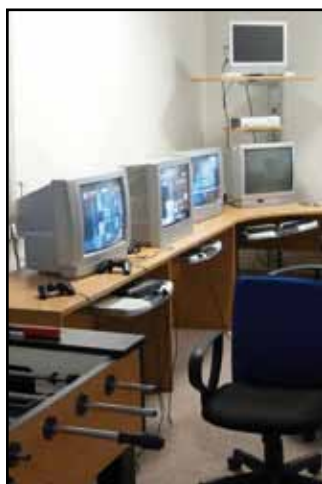
Část vybavení DDM v prostorách kulturního domu.

né dokoupit nádobí, myčku, digestoř a další věci, aby vše splňovalo hygienické předpisy. Místnost je totiž využívána nejen při plesech, ale probíhá zde i kroužek pečení a vaření pro děti.