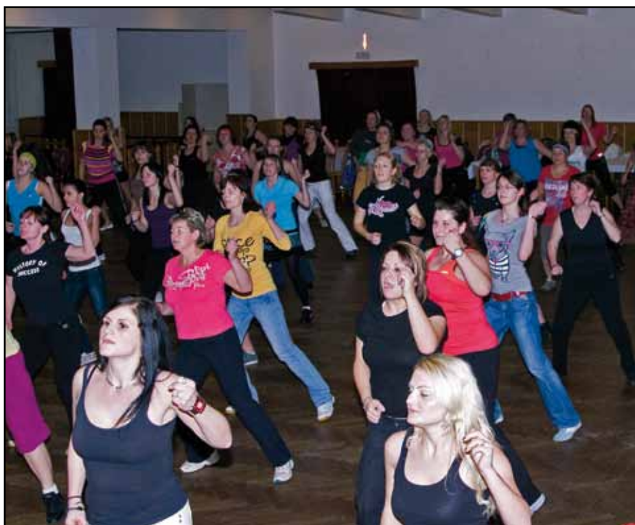
Zumba party se v sále kulturního domu zúčastnilo 22. ledna 63 tanečnic.

Mnozí z Vás si jistě všimli nebo alespoň zaslechli, že se v našem kulturním domě něco děje. Celý objekt ožil, je zde stále někdo - děti i dospělí - od rána až do pozdního večera, od pondělí až do neděle. Proto jsem zašla za kompetentní osobou - paní Pavlínou Karlovskou, vedoucí Domu dětí a mládeže v Nýrsku.