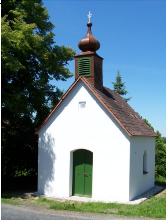
Kaple na Blatech