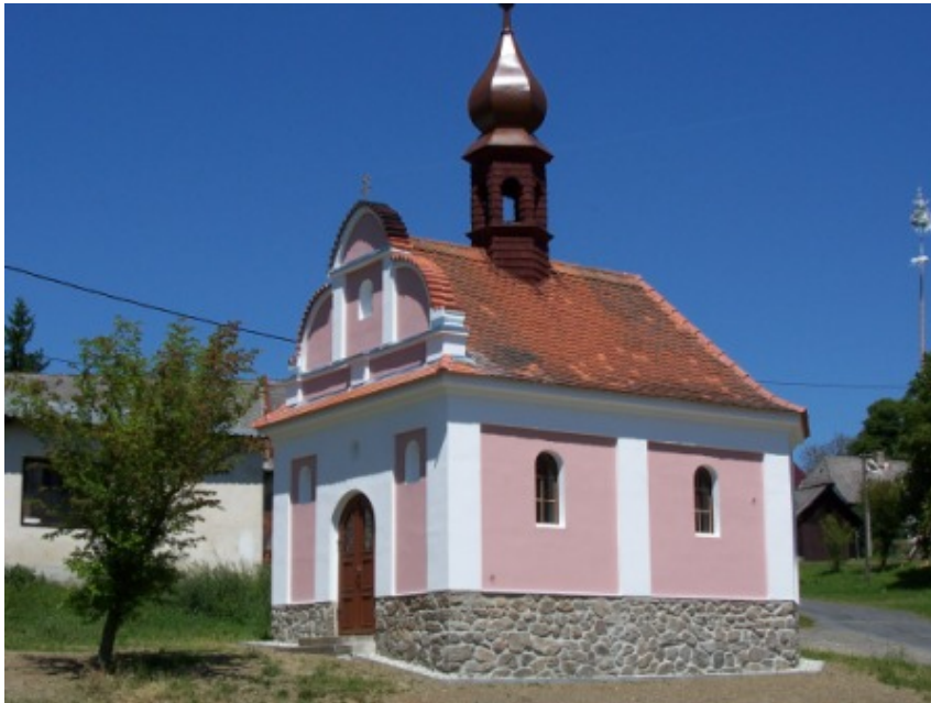
Kaple v Hodousicích