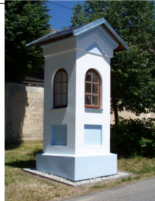
Boží muka v Bystřici nad Úhlavou