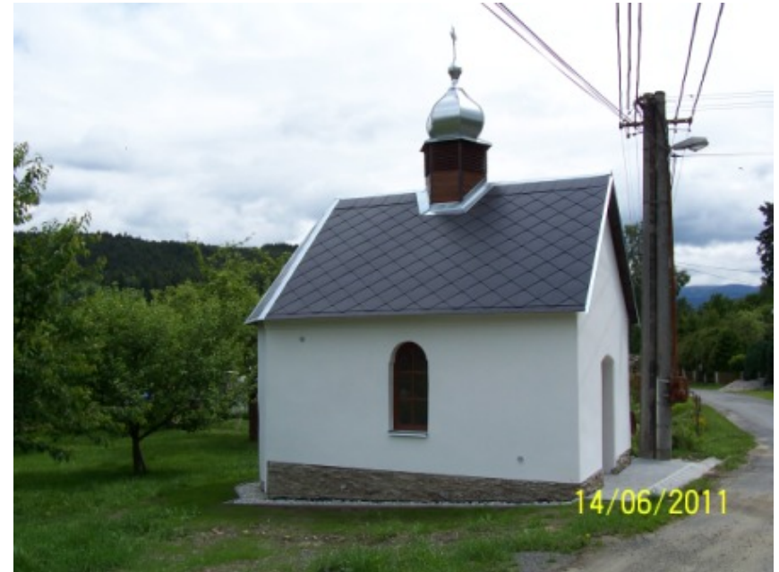
Kaple ve Staré Lhotě