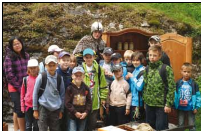
Pavčina Karlovská Z příměstských táborů DDM.