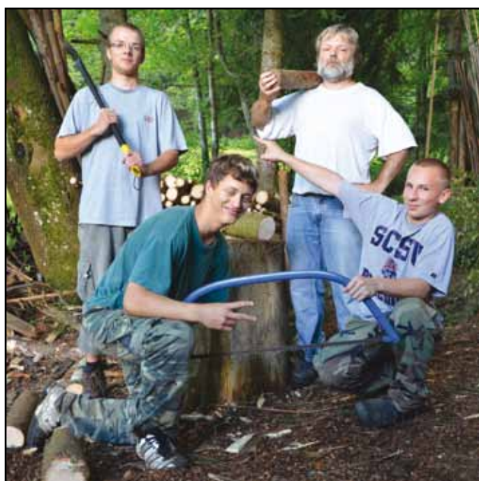
Z činnosti v táboře.

Od 13. do 20. srpna proběhl v pořadí druhý ALFA tábor přežití. Zúčastnilo se ho 13 dětí z Nýrska a okolí. Jak již samotný název napovídá, jednalo se o tábor, kde kromě stavby kuchyně, pece, záchodu, teepee a dalších nezbytností táborového života, bylo hlavním cílem přežít. Zpestřením bylo dobývání hradu Velhartice, protože kastelán tohoto hradu se se svou družinou pod rouškou tmy dopustil loupeže táborových věcí. Vše dobře dopadlo, spor byl urovnán, věci navráceny a děti se těší na příští léto.