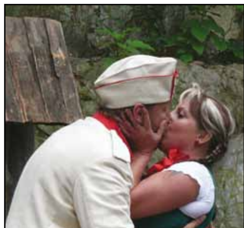
Nýrští ochotníci při vystoupení 2. 7. 2011 - pohádka Hrátky s čertem .