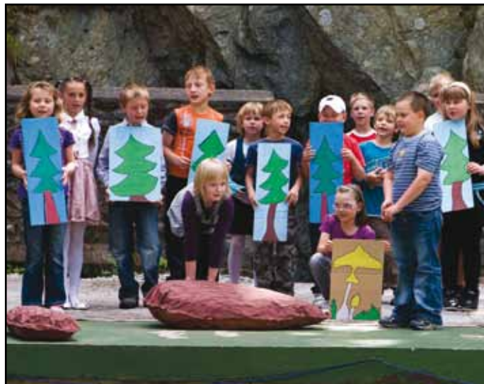
Dětské představení v Lesním divadle 18. května.