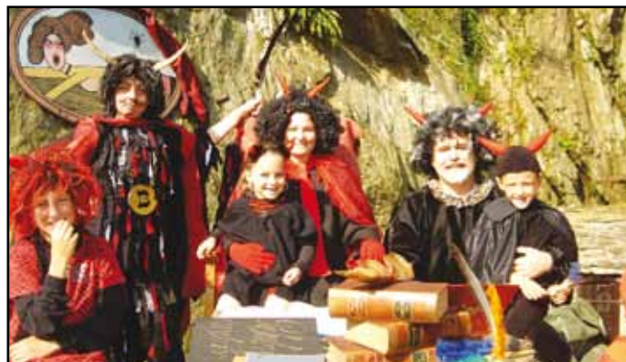
Nýrští ochotníci při vystoupení 21. května.

Dalším představením pro širokou veřejnost bylo 21. května opakování hry domácích ochotníků „Dalská báty, hříšná ves, aneb zapomenutý čert“. Klasický kus z loňského nastudování přilákal i v krásném počasí téměř 300 diváků. Představení se také povedlo. A dle informací od herců, již nyní pilně nacvičují hru „Hrátky s čertem“. Můžeme se těšit první sobotu v červenci, snad nám všem bude počasí opět přát. Ještě předtím nás ale v sobotu 4. června navštíví divadelní soubor z Klatov se hrou „Vítejte v Ebersteinu, jídlo chutné, ceny mírné.“ Tento soubor u nás zatím ještě nehrál, takže přijďte se podívat, ať máte možnost srovnání. Jitka Vlková