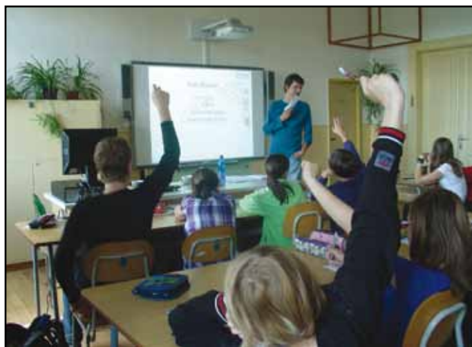
Z přednášek M. Franty.

Mildovi děkuji za dobrou práci a posluchačům přeji, aby v nich zůstalo minimálně vědomí toho, že mají život ve svých rukách. Nevybereme si komu a kde se narodíme, nemáme všichni stejnou startovní pozici, ale volbou přátel, svojí aktivitou, trpělivostí a vytrvalostí, můžeme mnohé změnit.