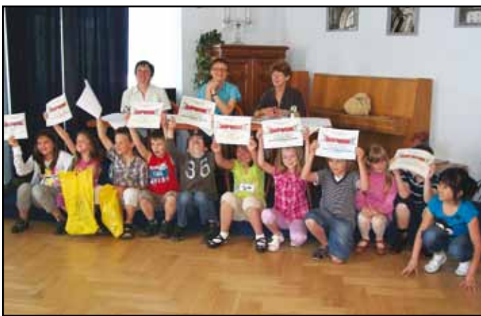
Účastníci klání ve čtení v sále Městské knihovny v Klatovech.