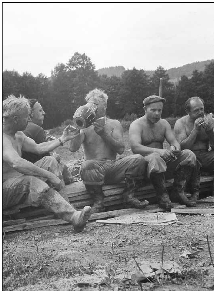
Svačící rybáři - jedna z nových fotografií v nýrském muzeu.

Pátý den ráno bylo po ránu nebe modré, jakoby jiná barva ani neexistovala. Horko začalo být ještě větší, takové nezdravé, mokré. Šestý den to ale přece jen bylo