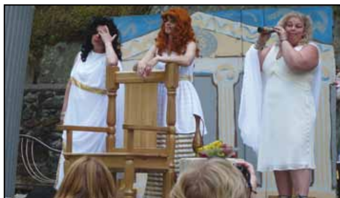
Sezonu v Lesním divadle zahájili dešeničtí ochotníci.