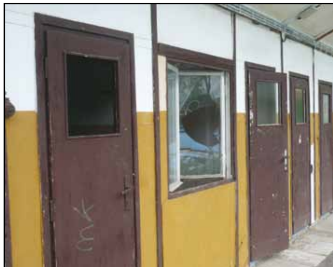
Poškozené kabiny na koupališti.

Přípravu bohužel prodlouží a prodraží řádění vandálů, kteří v polovině května svými „siláckými“ kousky poškodili zařízení kabin i budovu kiosku. Škoda ve výši cca 10 tis. Kč je na úkor rozpočtu na koupaliště a tato částka se musí ušetřit na jiných službách poskytovaných návštěvníkům. (MěÚ)