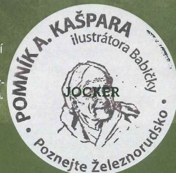
POMNÍK A. KAŠPARA