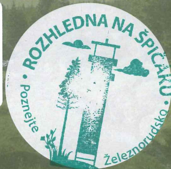
ROZHLEDNA NA ŠPIČÁKU