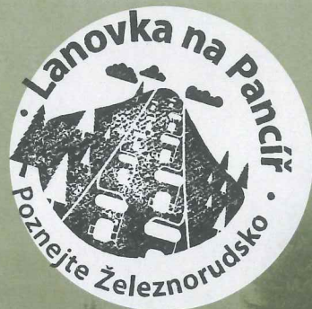
LANOVKA NA PANCÍŘ