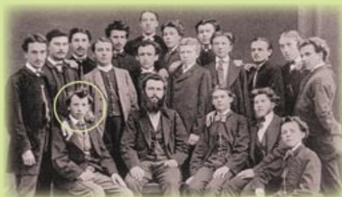
Oktáva klatovského gymnázia v roce 1872. V kroužku je Jaroslav Vrchlický, Oktava des Gymnasiums von Klatovy im Jahr 1872. Im Ring ist Jaroslav Vrchlický "The eighth form of the gymnasium of Klatovy in 1872. Jaroslav Vrchlický is in the circlet"