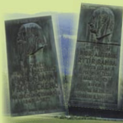
Pamětní desky Jaroslava Vrchlického a Antonína rytíře Randy Gedenktafeln von Jaroslav Vrchlický und Antonín Ritter Randa Memorial plaques of Jaroslav Vrchlický and Antonín Knight Randa