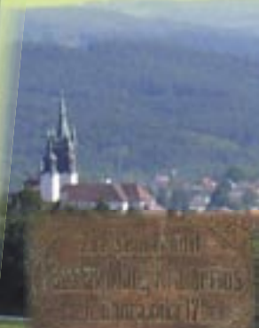
Pamětní deska Václava Matěje Krameria Gedenktafeln von Václav Matěj Kramerius Memorial plaque of Václav Matěj Kramerius