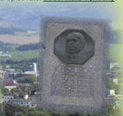
Pamětní deska K. B. Štorcha Gedenktafeln von K. B. Štorch Memorial plaque of K. B. Štorch