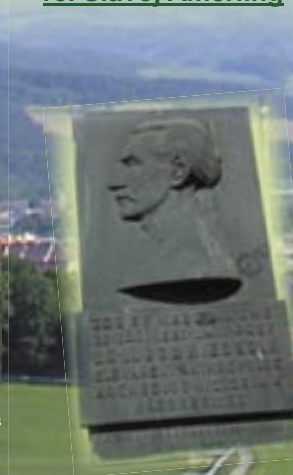
Pamětní deska Lubora Niederleho Gedenktafeln von Lubor Niederle Memorial plaque of Lubor Niederle